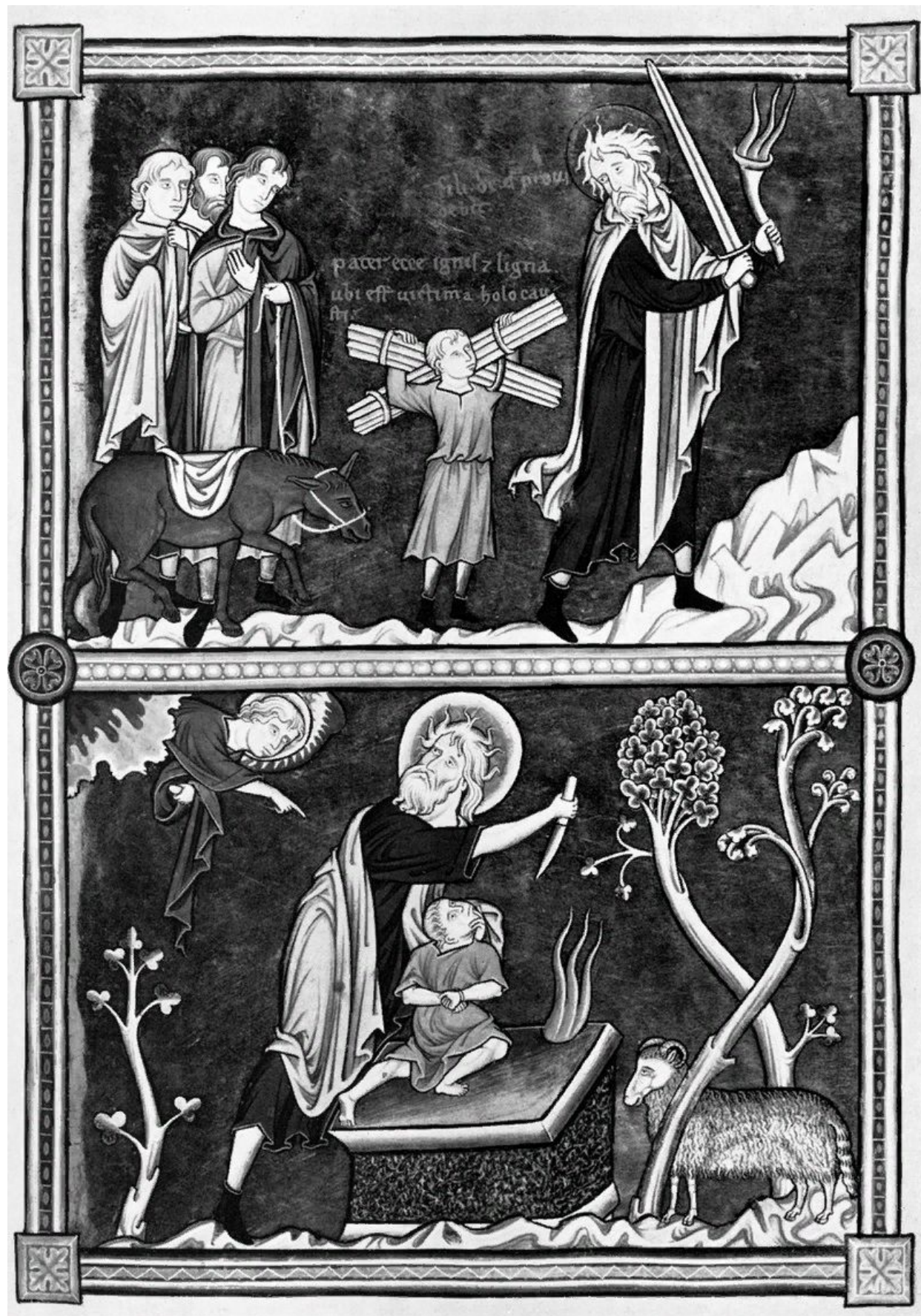
«Гостеприимство Авраама» «Жертвоприношение Авраама»