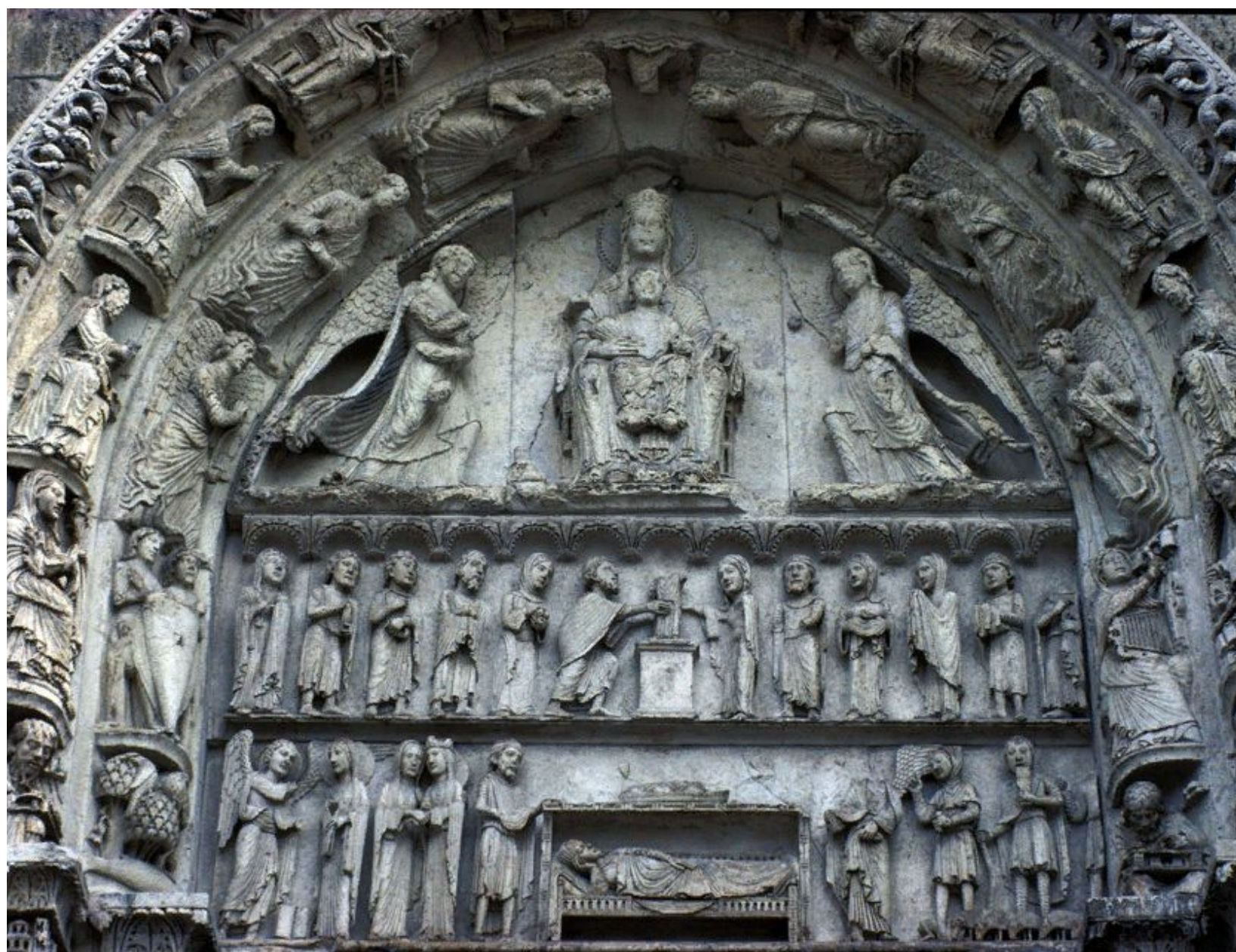
Скульптура северного портала Шартрского собора, Франция