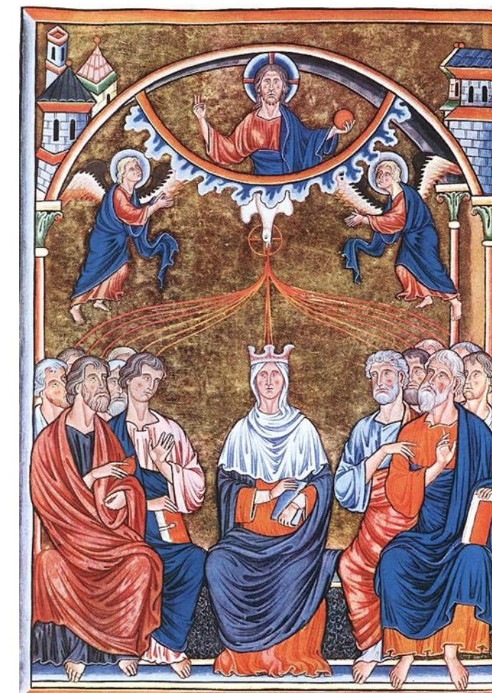
Псалтырь королевы Ингеборг, фрагмент