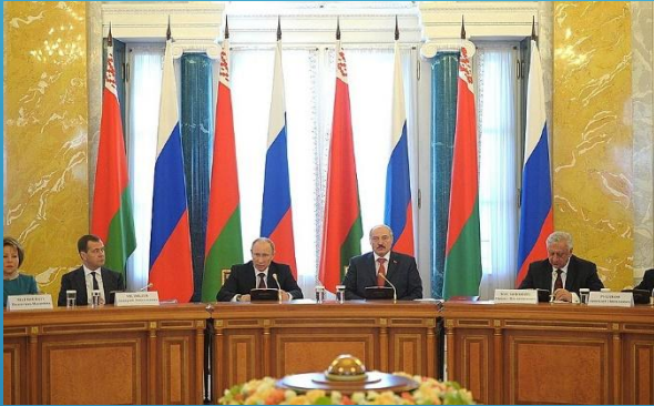
Высший Государственный Совет