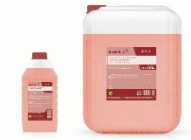
КИСЛОТНОЕ НИЗКОПЕНОЕ МОЮЩЕЕ СРЕДСТВО