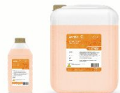
НЕЙТРАЛЬНОЕ СРЕДСТВО ДЛЯ МЫТЬЯ ПОЛА