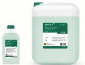
СРЕДСТВО ДЛЯ МЫТЬЯ ФАСАДОВ ЗДАНИЙ