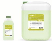
СРЕДСТВО ДЛЯ ЕЖЕДНЕВНОЙ УБОРКИ