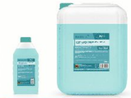
СИЛЬНОЩЕЛОЧНОЕ ВЫСОКОПЕНОЕ МОЮЩЕЕ СРЕДСТВО