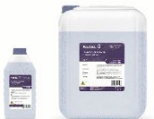
ЖИДКОЕ КРЕМ- МЫЛО С ГЛИЦЕРИНОМ