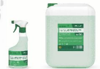
МНОГОКOMPONENTНОЕ НЕЙТРАЛЬНОЕ ДЕЗИНФИЦИРУЮЩЕЕ СРЕДСТВО