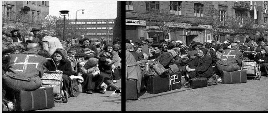
Немецкие беженцы после окончания боёв. 1945 год