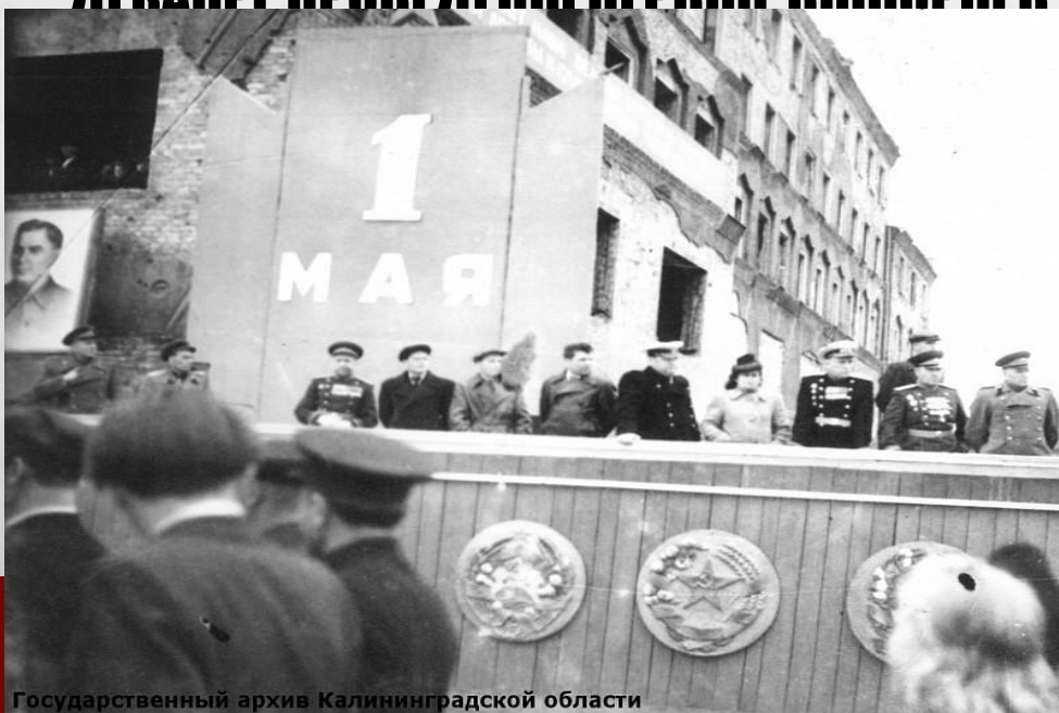
Государственный архив Калининградской области

1 мая 1947 года. Почётная трибуна возле нынешней администрации Калининграда.