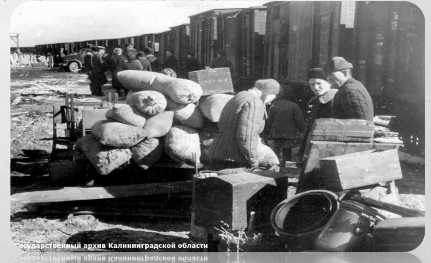
Государственный архив Калининградской области Государственный архив Калининградской области