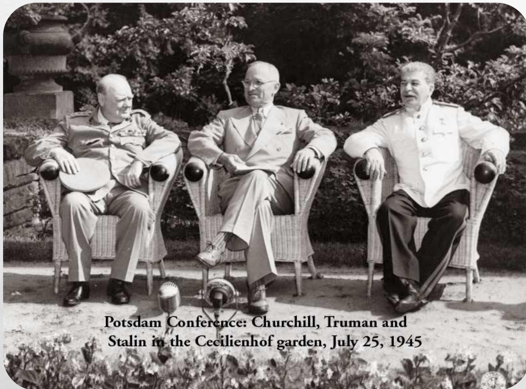
Potsdam Conference: Churchill, Truman and Stalin in the Cecilienhof garden, July 25, 1945