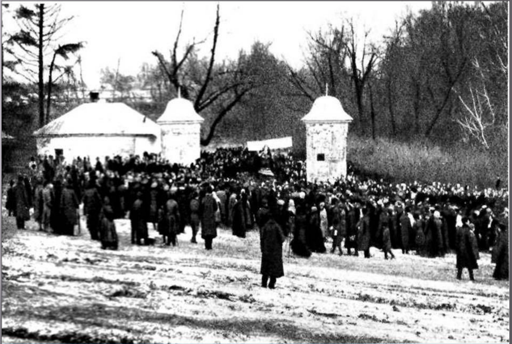
Похороны в Ясной Поляне 9 ноября 1910