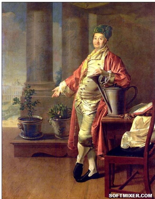
Прокопий Акинфиевич Демидов (внук)

Прокопий Акинфиевич Демидов (1710-1788) создал прекрасный ботанический сад в Москве ("Нескучный сад"), там была флора 4-х континентов. Московскому университету он подарил гербарий, который содержал около 4500 листов. Прокопий основал московский воспитательный дом, выплатив на него 1 миллион 107 тысяч рублей.