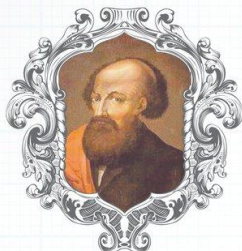
Никита Демидович, Антуфьев при рождении (1656-1725)