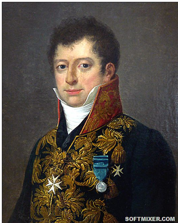
Николай Никитович Демидов (правнук)

Николай Никитович Демидов (1773-1828) был женат на Елизавете Александровне Строгановой.