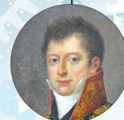
Николай Никитич (1773-1828)

Демидовы - семья горнозаводчиков и землевладельцев. Возвышение Демидовых началось при Никите Демидове (1656 - 1725), тульском кузнеце-оружейнике, сумевшем мастерством поразить Петра I и получившем земли на Урале и в Сибири для строительства металлургических заводов.