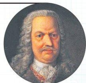
Акинфий Никитич Демидов (1678-1745)

Герб династии Демидовых. Императрица Екатерина I 24 марта 1726 года повелела выдать детям основателя рода Демидовых дворянский диплом. Тогда же Герольдии было поручено составить герб новой дворянской фамилии