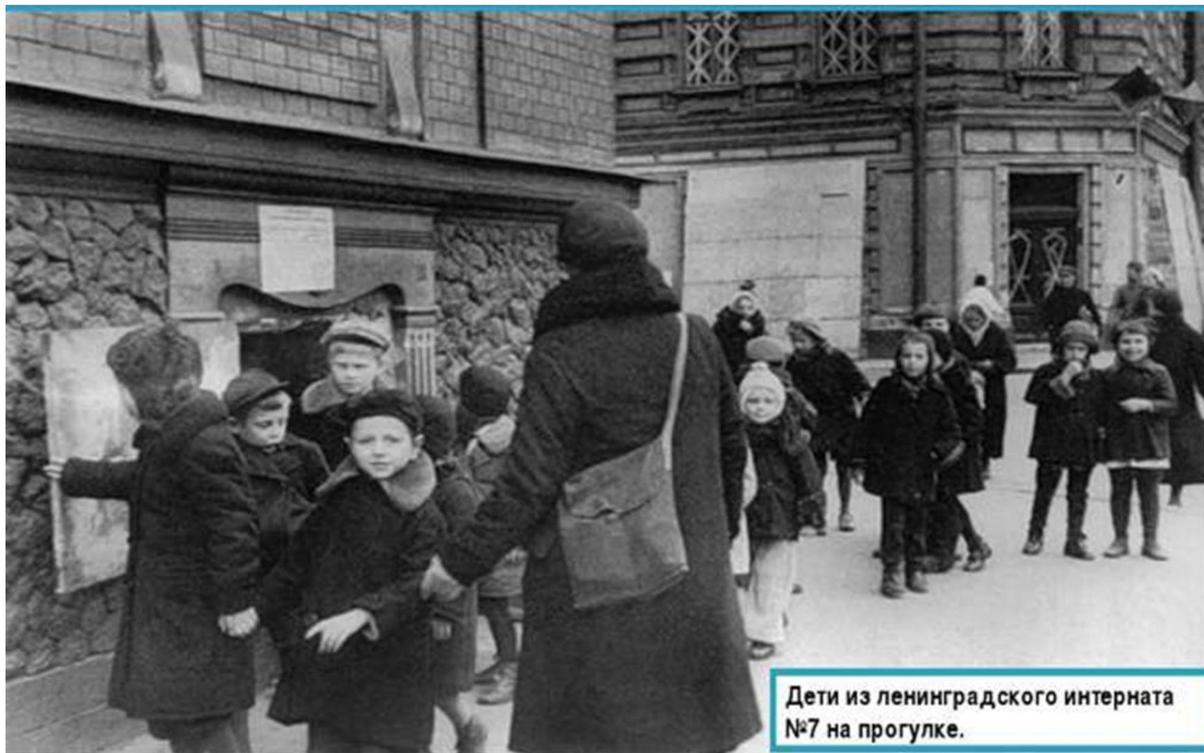
Дети из ленинградского интерната №7 на прогулке.

Что пережили ленинградские дети во время блокады? О том страшном времени нам помогут военные фотографии.