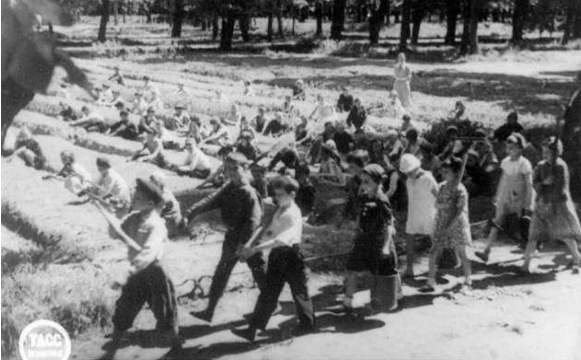
Школьники Дзержинского района идут на работу на огороды, находящиеся в Летнем саду. 10 июня 1943 г. Ленинград