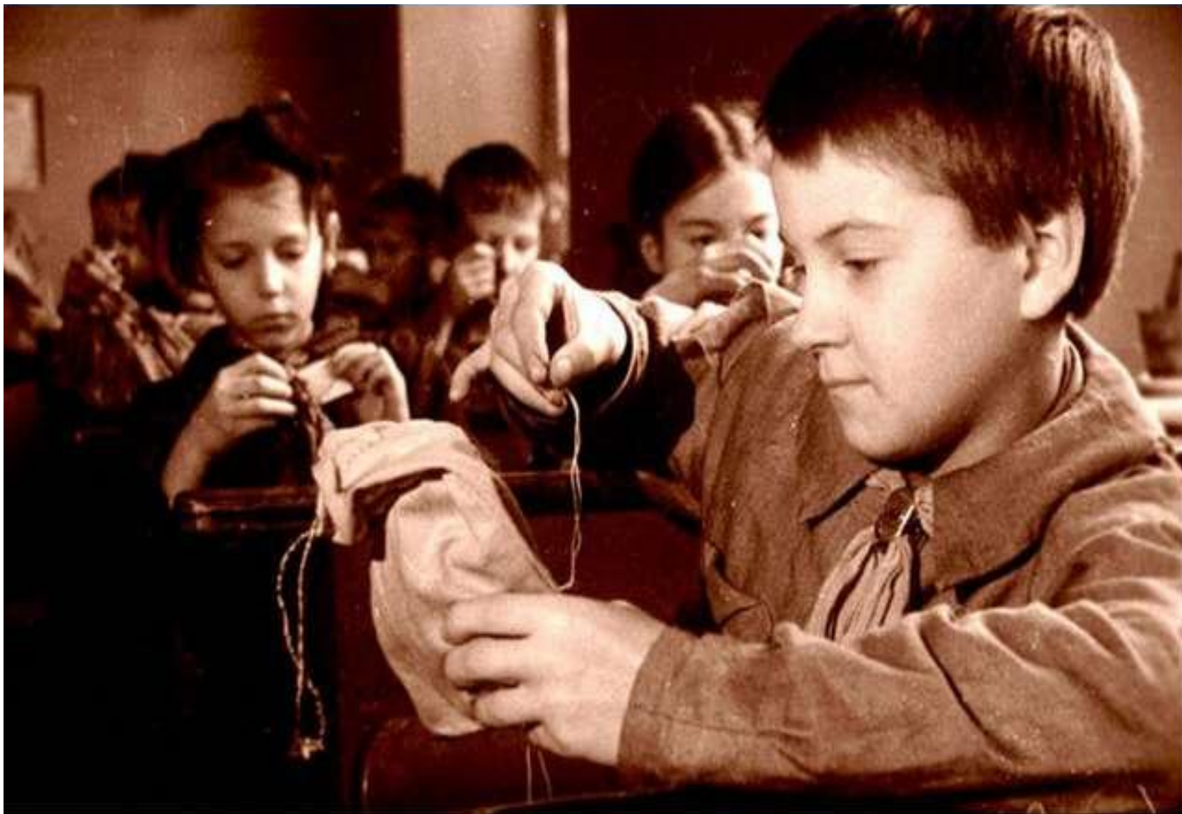
Учащиеся 3-го класса женской школы № 216 Куйбышевского района готовят кисеты в подарок фронтовикам.