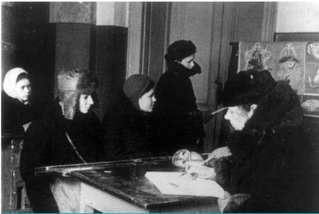
Школьный урок в ленинградском бомбоубежище. 1942 г