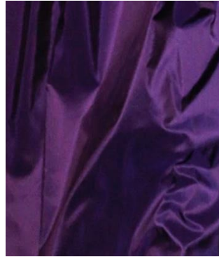
ПУРПУРН ЫЙ МЕТАЛЛИК