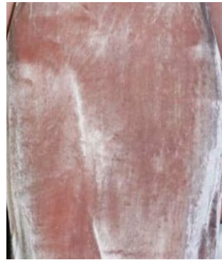
АНТИЧН АЯ РОЗА