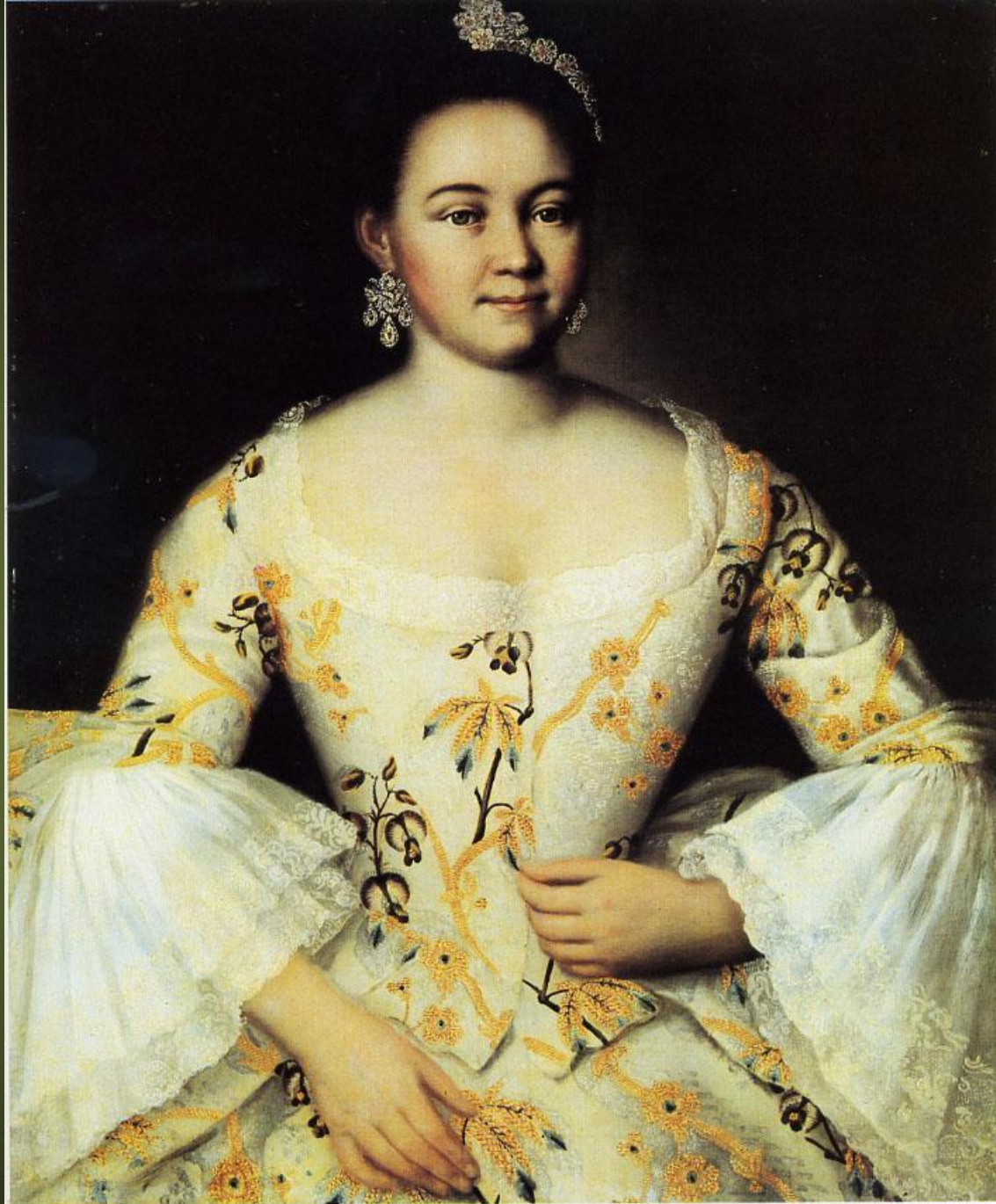
IVAN VICHNIAKOV (?). PORTRAIT DE S. YAKOVLEVA Milieu du XVIII e siècle. Musée de l'Ermitage