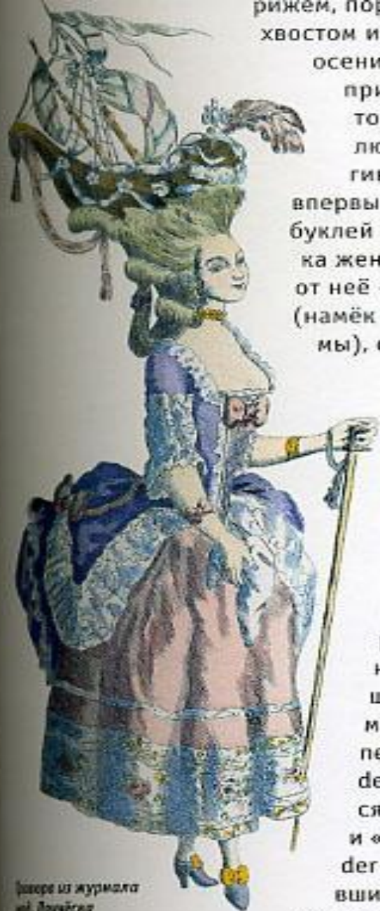
Рисунок из журнала «Вестник моды». Французский «фрегат» и платье пастель.

рижем, поре хвостом из осени, прич том люб гини впервые буклей и ка женщ от неё — (намёк н мы), сл