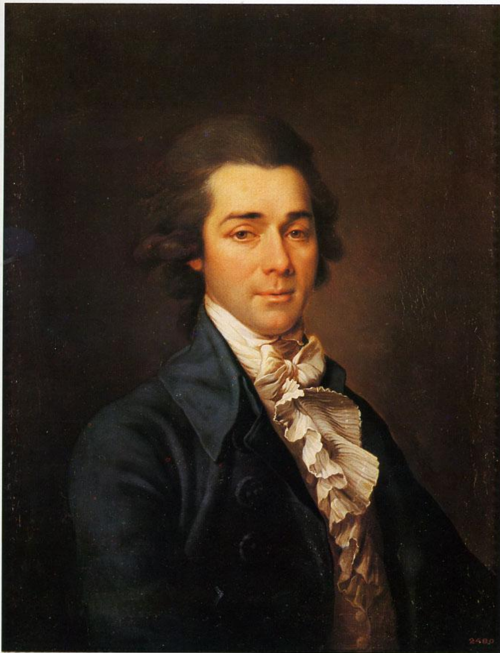
DIMITRI LEVITSKI. PORTRAIT DE N. L'VOV Années 1780. Musée Russe