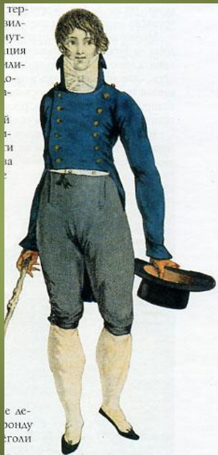
Парижанин. 1802 г. Новый модный костюм, пришедший на смену старому. Фрак (аби) с завышенной талией, с двойной застежкой, высоким воротником и галстуком, подпирающим щеки. Шелковые кюлоты еще актуальны днём и обязательны на балу.