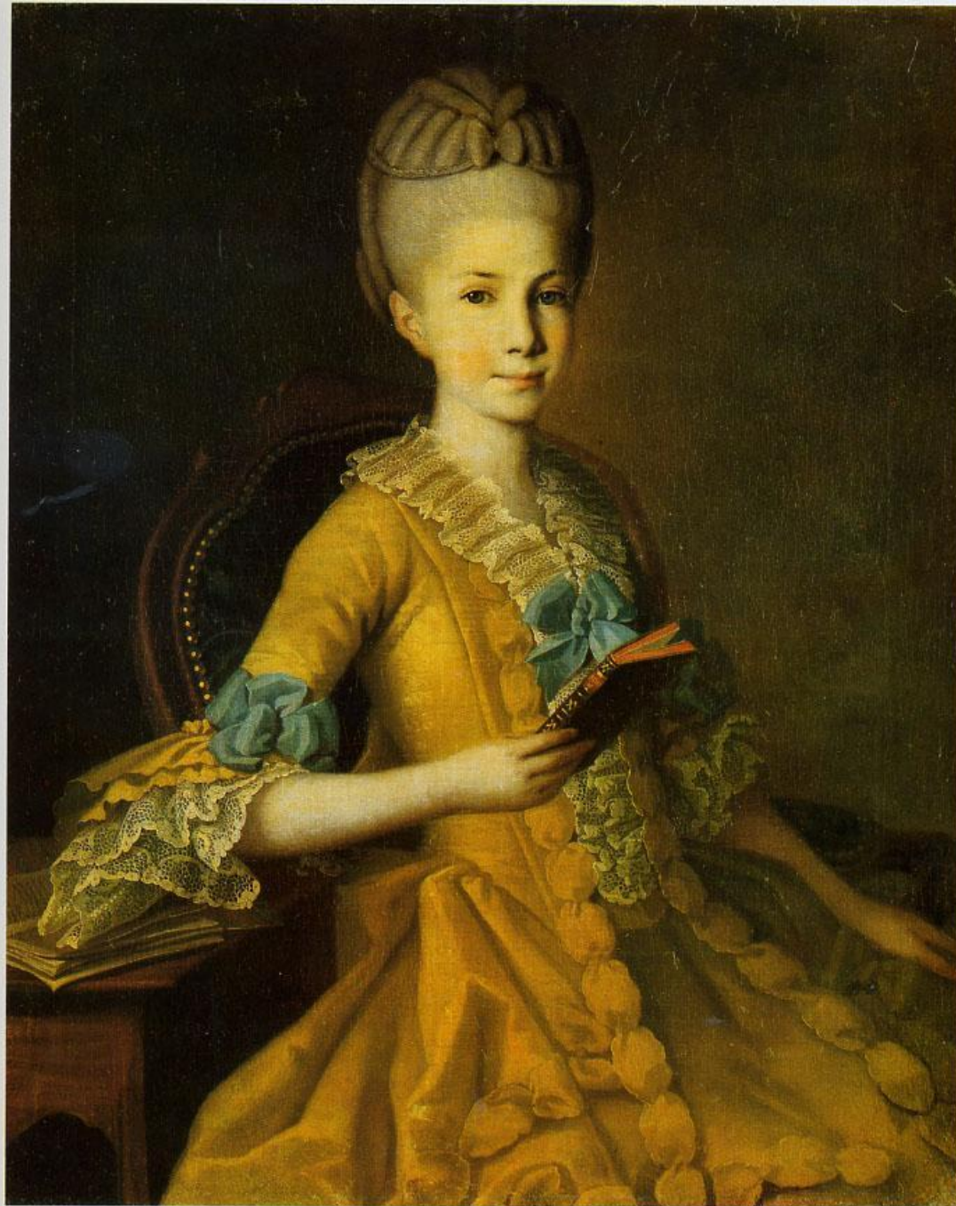
CARL CHRISTINECK. PORTRAIT DE E. MORDVINOVA. 1773 Musée Russe