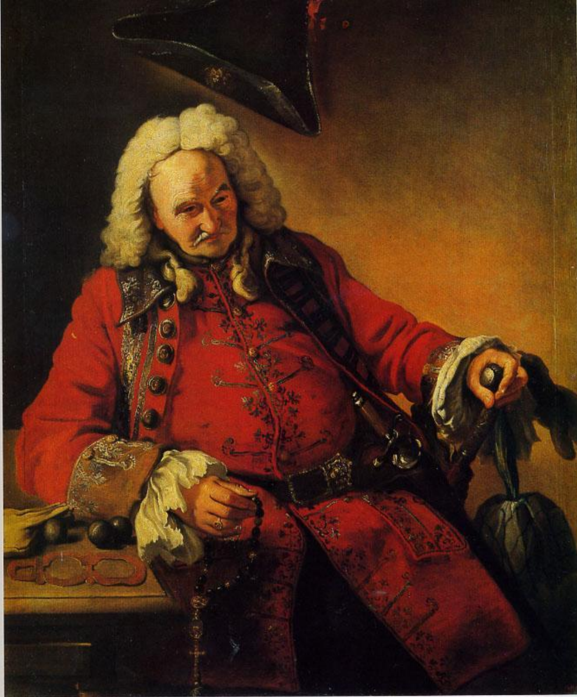
PEINTRE ANONYME. PORTRAIT DE VIEILLARD EN CAFETAN ROUGE Premier quart du XVIII e siècle. Musée Russe