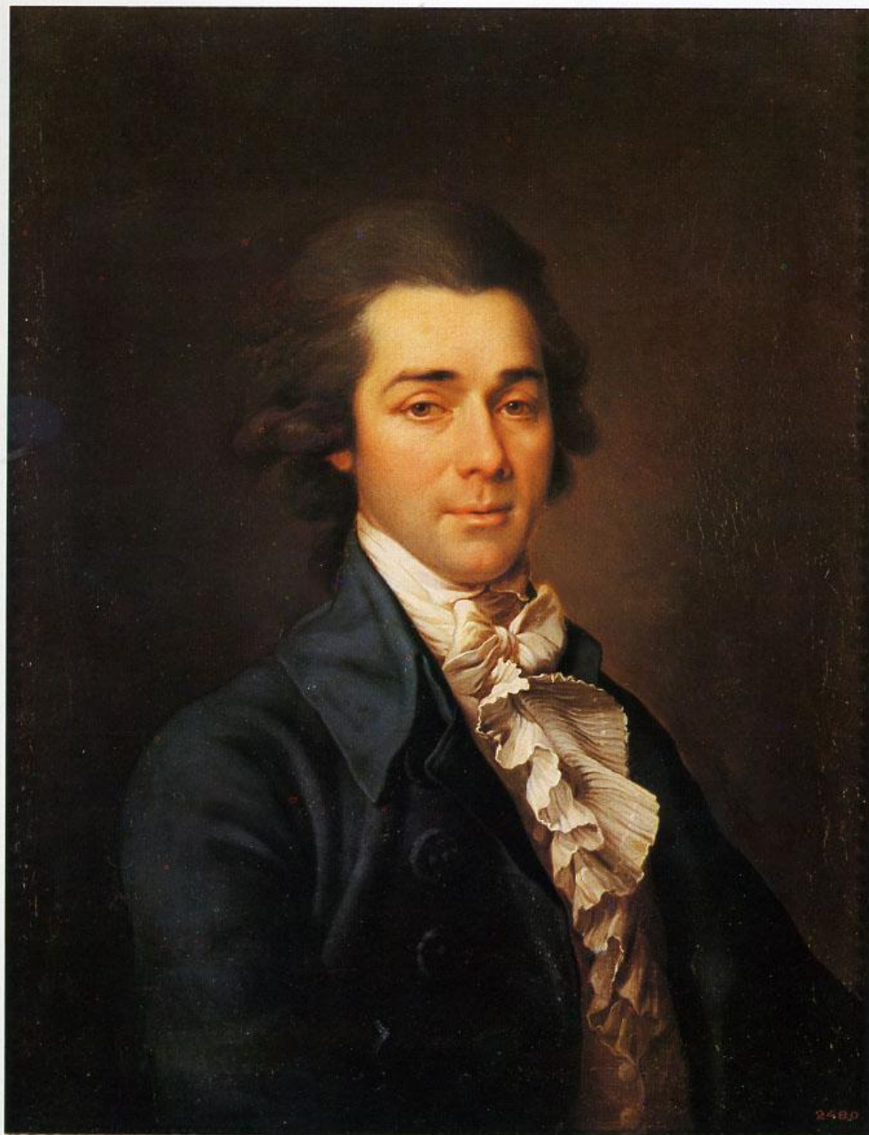
DIMITRI LEVITSKI. PORTRAIT DE N. L'VOV Années 1780. Musée Russe