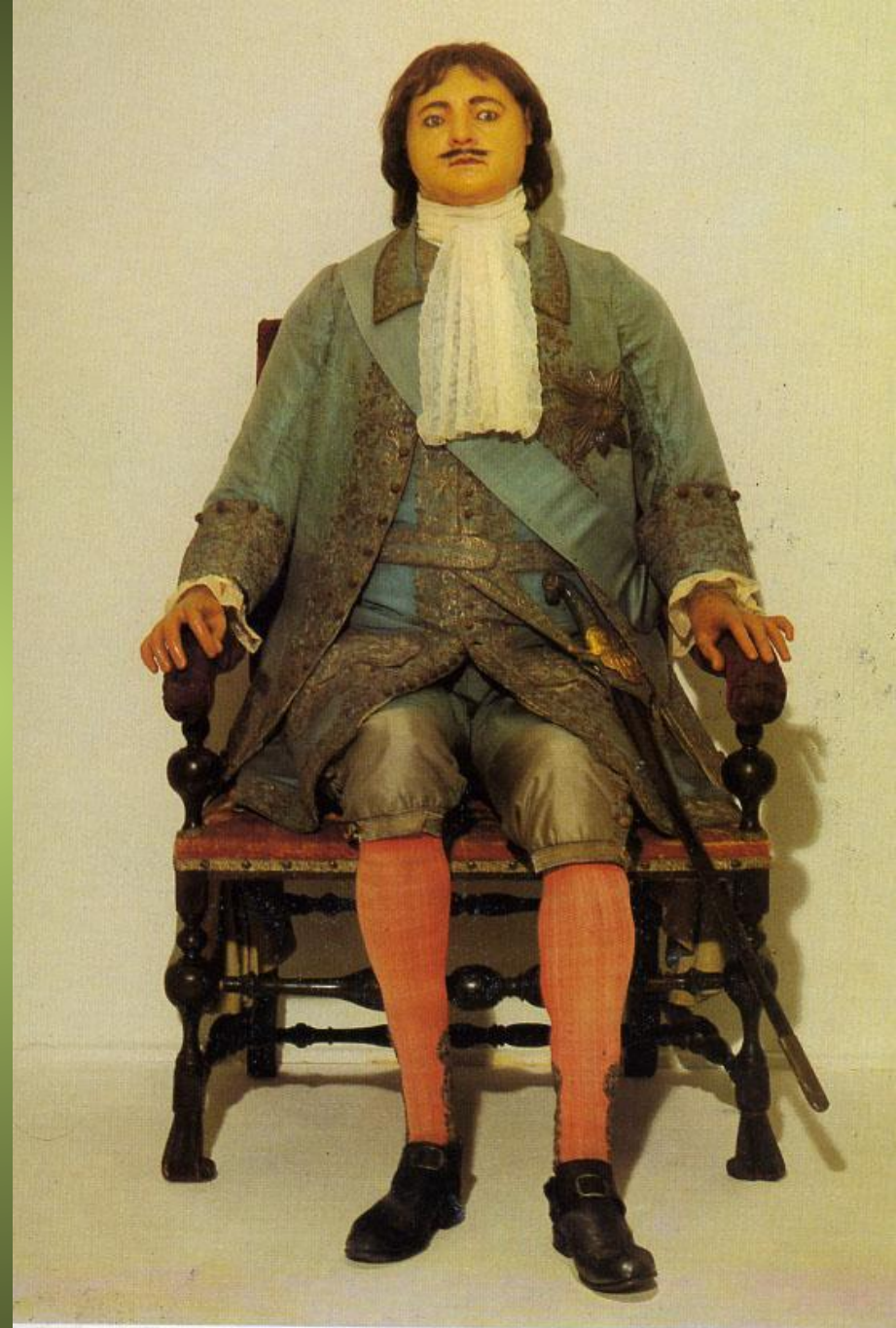
CARLO BARTOLOMEO RASTRELLI. FIGURE DE CIRE. 1725. Musée de l'Ermitage