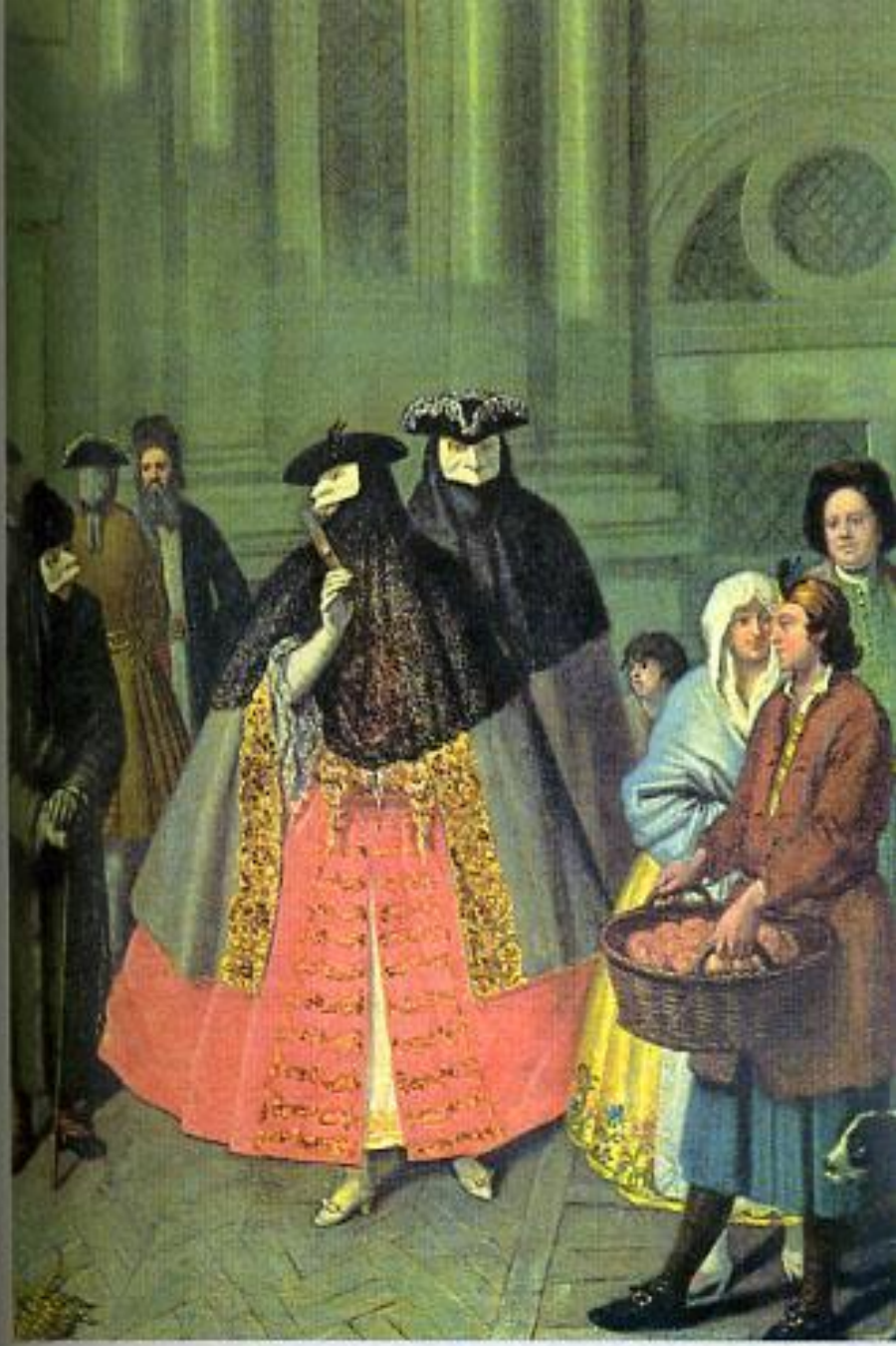
Пьетро Лонги. Разговор масок. Венецианская мода XVIII в.