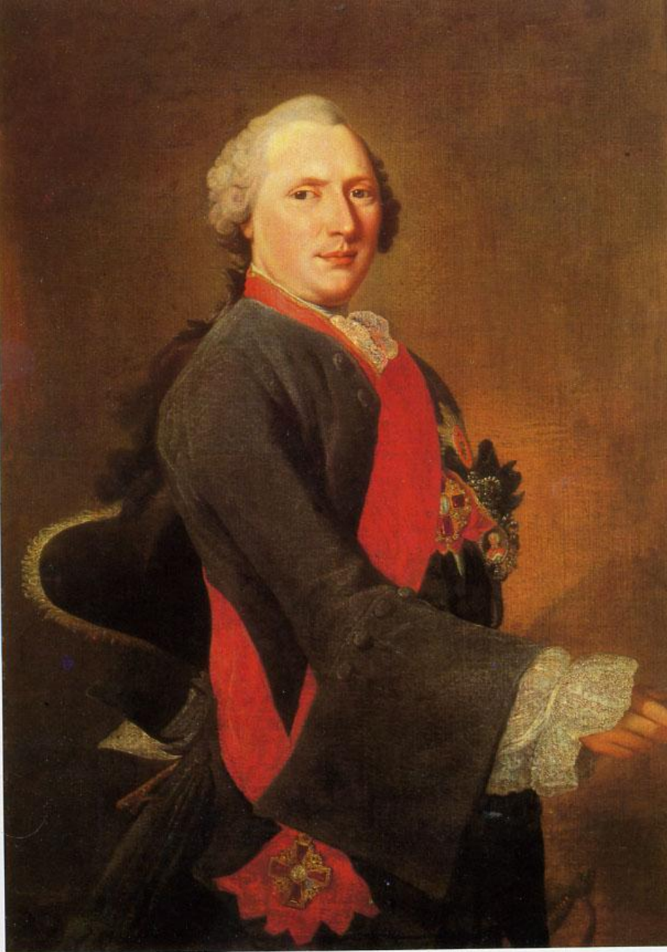
GEORG CASPAR PRENNER, PORTRAIT DE J.E.SIEVERS Milieu du XVIII e siècle. Musée de l'Ermitage