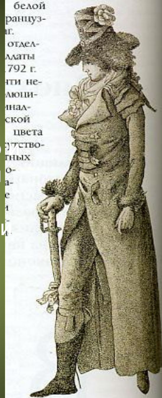
Гравюра из журнала мод, 1791 г. Редингот а-ля Левит с несколькими воротниками.

1797. Короткий спенсер подобранное спереди платье. Редингот с несколькими воротниками.