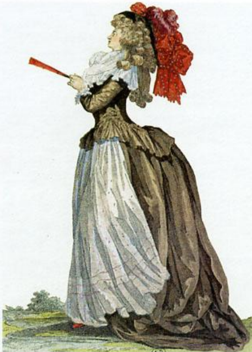
Галерея мод и костюмов. 1785 г. Библиотека Музея декоративных искусств. Париж. Верхний жакетик карако.