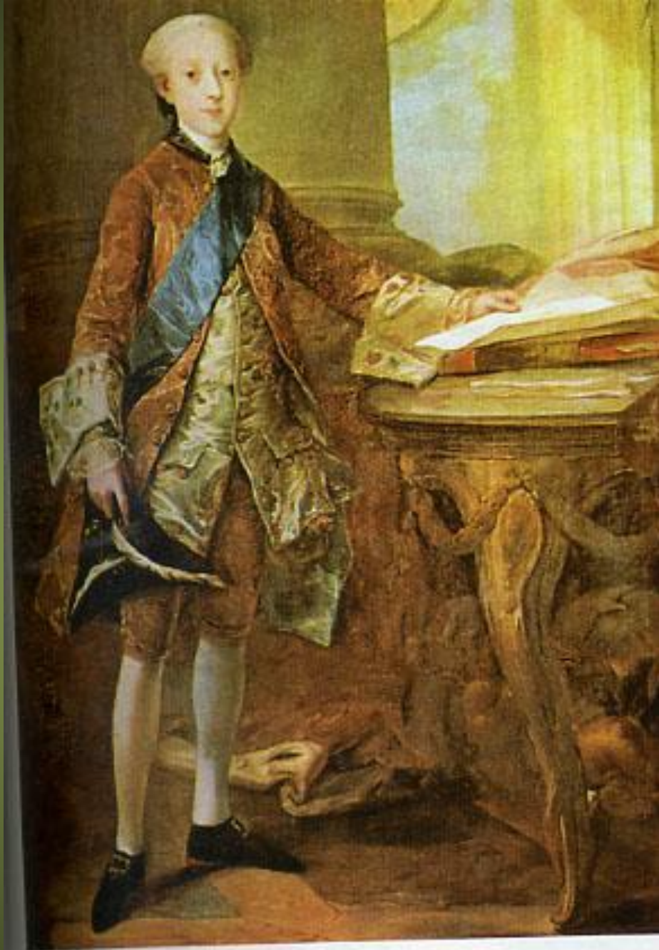
Юхан Вилле. Кронпринц Кристиан VII. 1762 г. Национальный музей, Фредерихсборг. Жюстокор с разлетающимися полами.