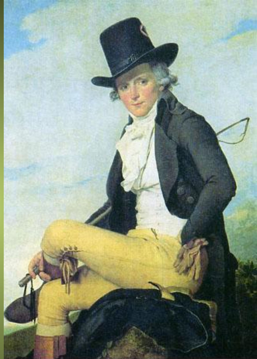
Жак Луи Давид. Пьер Серизиа. 1795 г. Лувр. Париж. Тип делового мужчины: практичный суконный фрак, замшевые штаны, сапоги и цилиндр.

Жак Луи Давид. 1795. Тип делового мужчины: практичный суконный фрак, замшевые штаны, сапоги и цилиндр