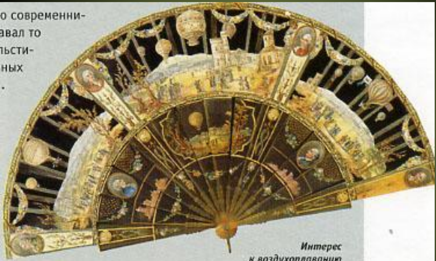
Интерес к воздухоплаванию отразился и в моде.