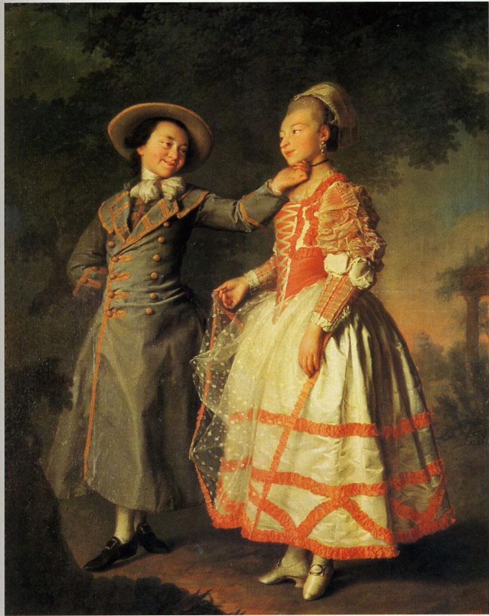
DIMITRI LEVITSKI. PORTRAIT DE E. KHOVANSKAÏA ET E. KHROUCHTCHÉVA. 1773 Musée Russe