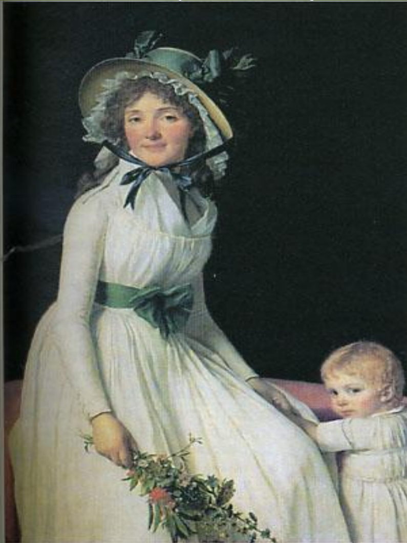
Жак Луи Давид. Эмилия Серизиа. 1795 г. Лувр. Париж. Теп женщины: нежная мать и жена. Одета в прямое светлое платье, спласское лентой, подчёркивающей грудь и тонкую талию, и соломенную шляпу с газелии от солнца. Английская мода — простота, элегантность и целесообразность.