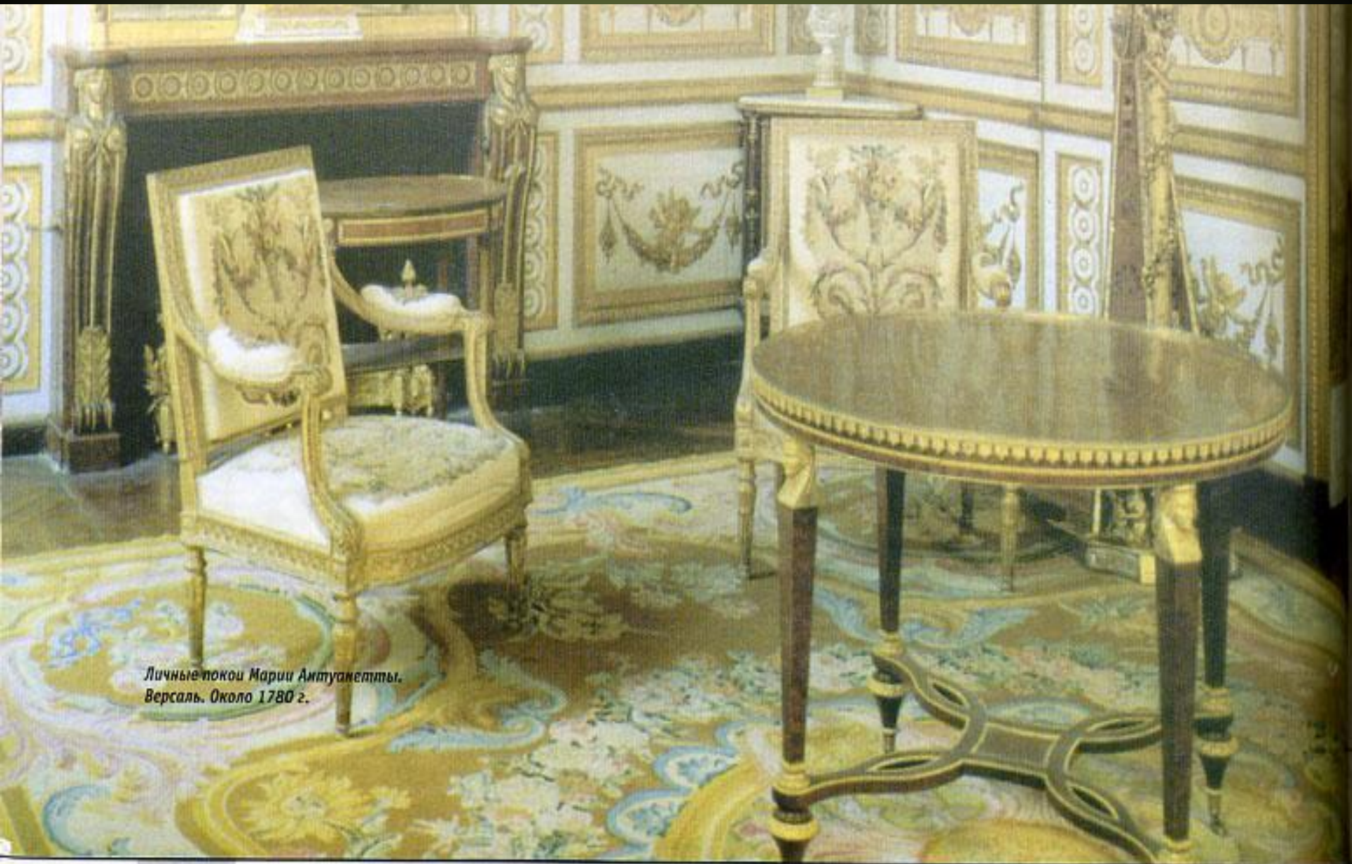
Личные покои Марии Антуанетты. Версаль. Около 1780 г.