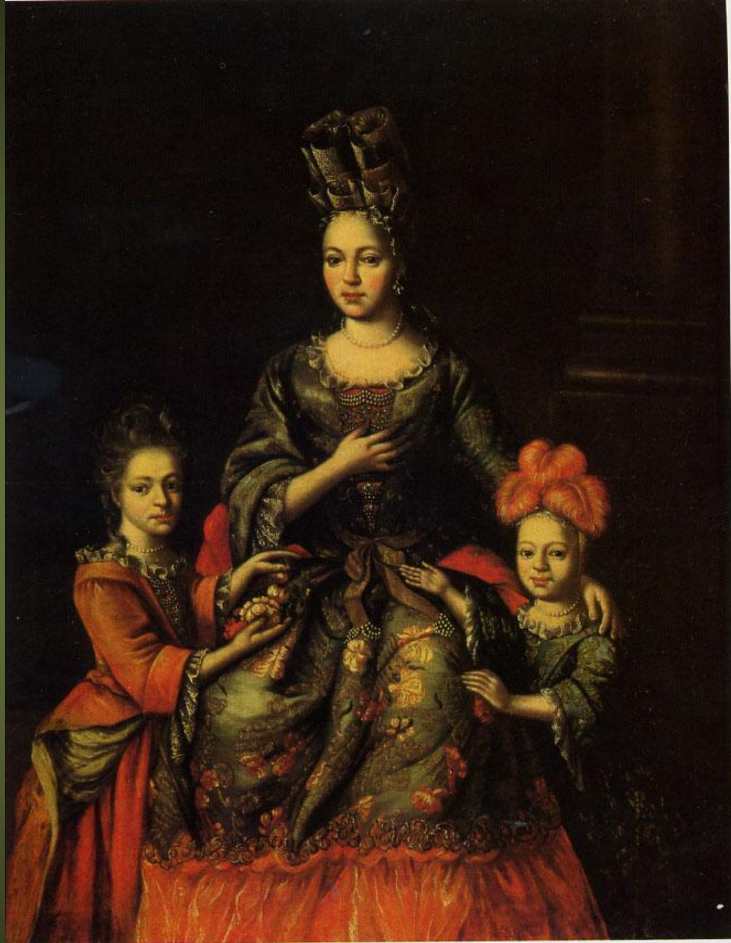
PEINTRE ANONYME, PORTRAIT DE A. NARYCHKINA AVEC SES ENFANTS Premier quart du XVIII e siècle. Galerie Trétiakov