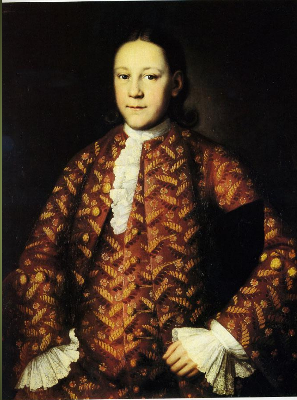
IVAN VICHNIAKOV (?), PORTRAIT DE M. YAKOVLEV Milieu du XVIII e siècle. Musée de l'Ermitage