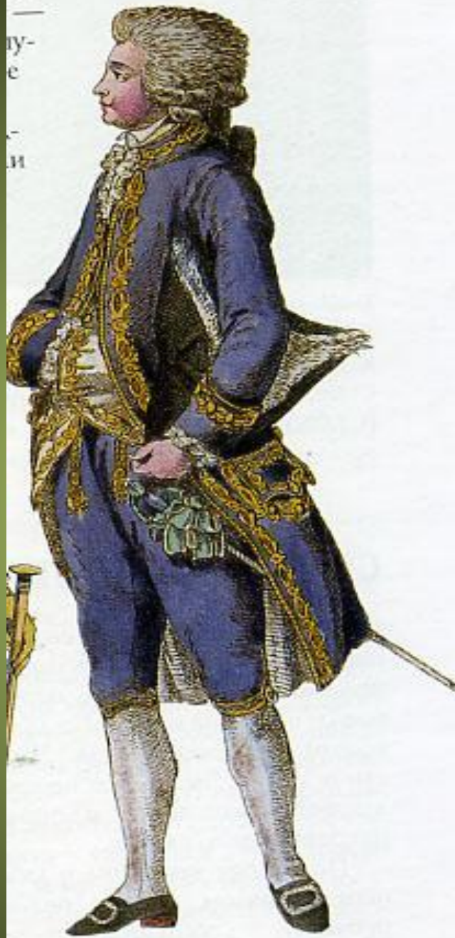
Аби — переходная форма от жюстокора и фраку. 1786 г.