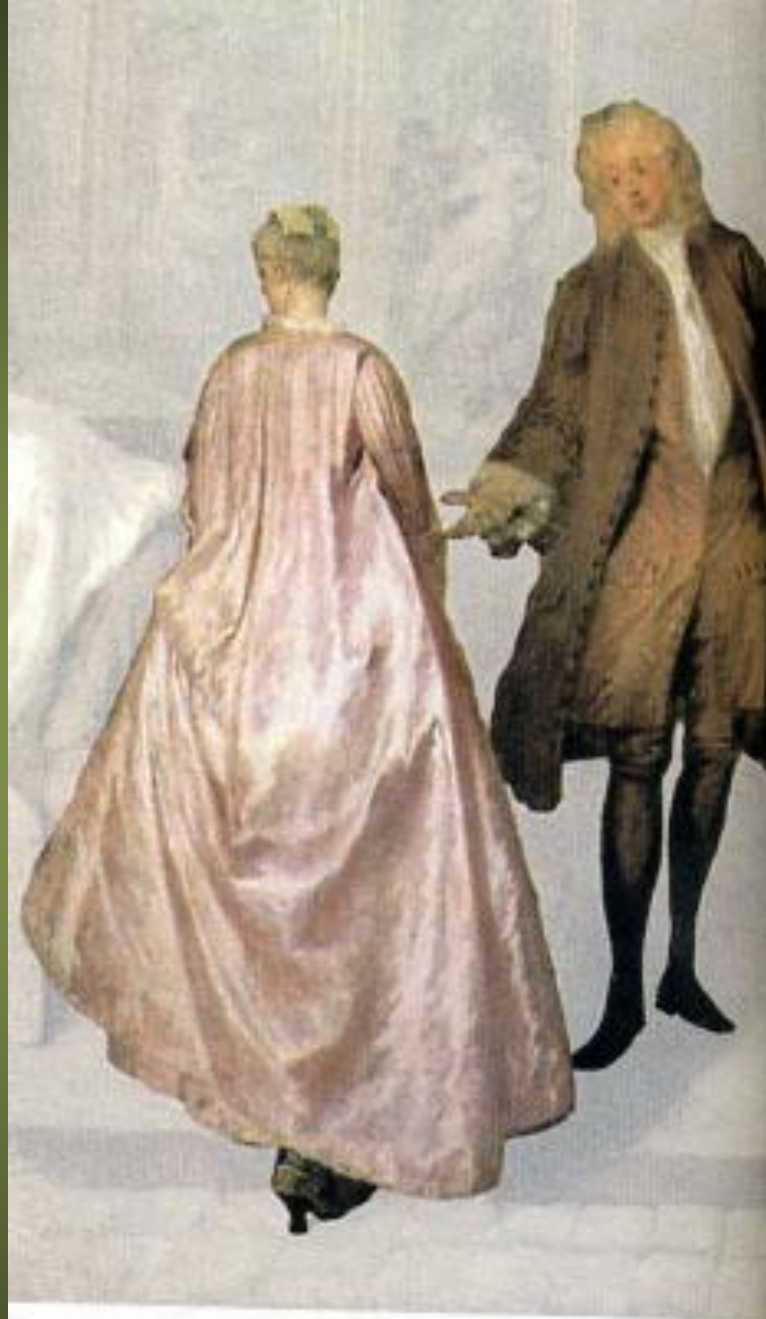
Антуан Ватто. Вывеска лавки Жерсена. Фрагмент. 1821 г. Шарлоттенбург. Б