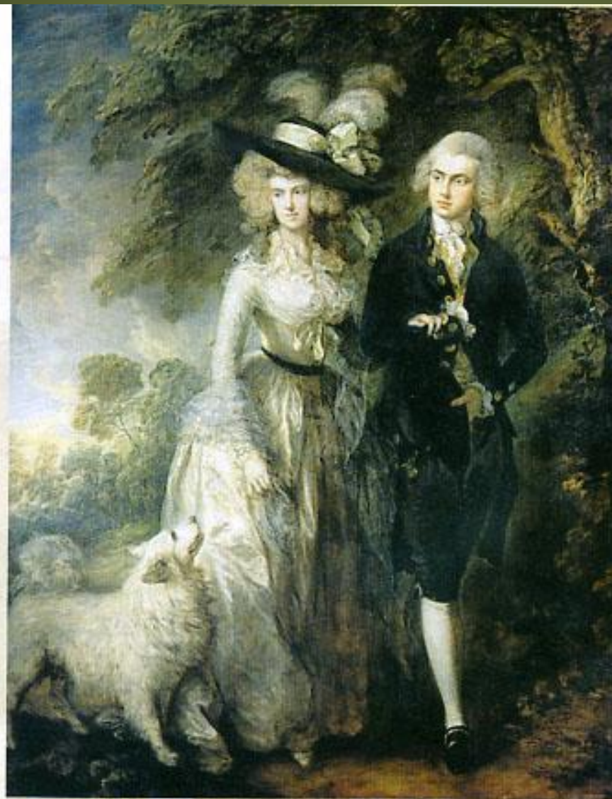
Томас Гейнсборо. Утренняя прогулка. 1785 г. Национальная галерея. Лондон. Живописные естественные формы одежды по английской моде.