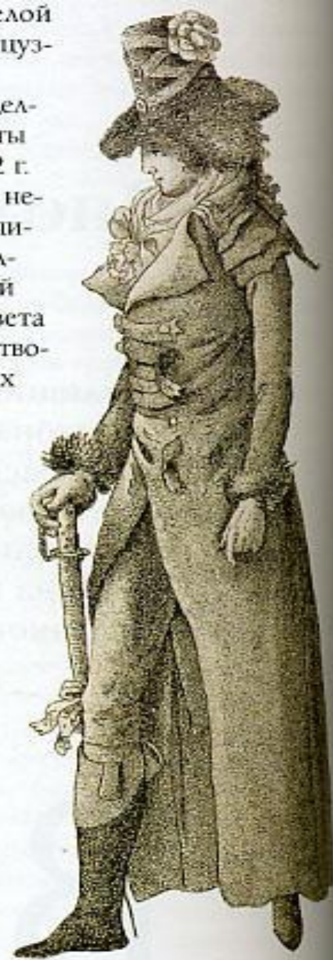
Гравюра из журнала мод, 1791 г. Редингот а-ля Левит с несколькими воротниками.

1797. Короткий спенсер подобранное спереди платье. Редингот с несколькими воротниками.