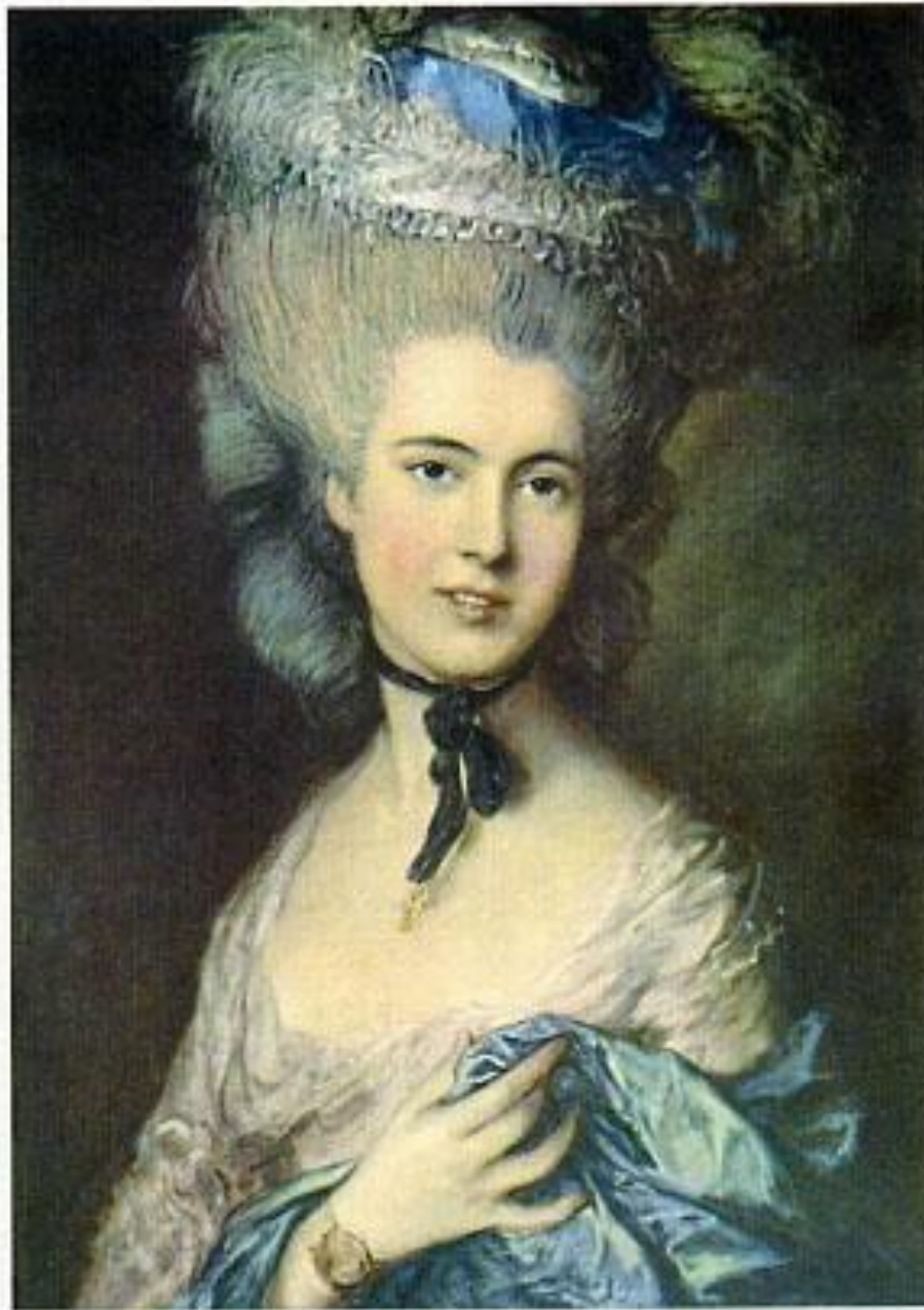
Томас Гейнсборо. Герцогиня де Бофор. 1770 г. Эрмитаж. Санкт-Петербург.