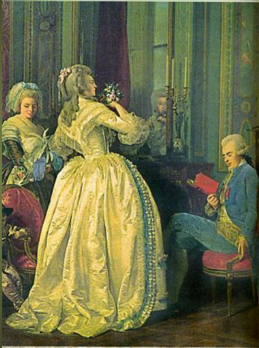
Александр Рослин. Семья Мартино с цветами. Увядая роскошь рококо — французский костюм.