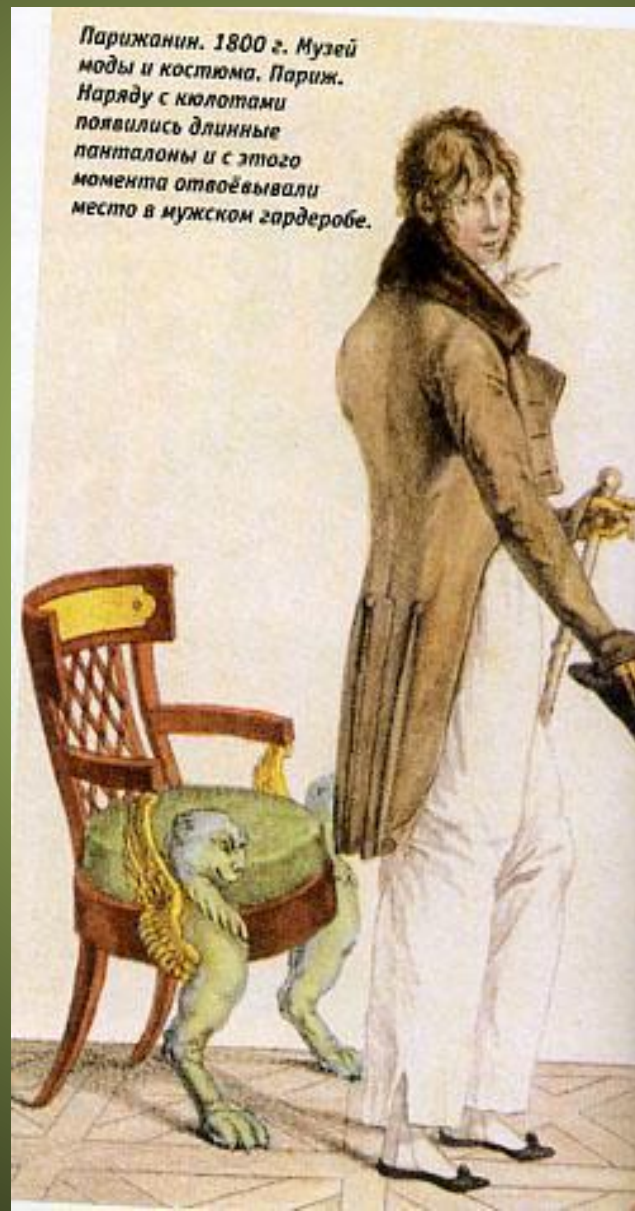
Парижанин. 1800 г. Музей моды и костюма. Париж. Наряду с кюлотами появились длинные панталоны и с этого момента отвоёвывали место в мужском гардеробе.