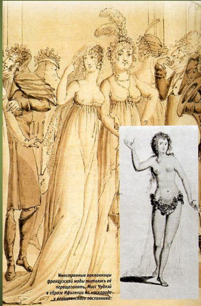
Иностранные поклонницы французской моды пытались её перещеголять. Мисс Чудлэй в образе Ифигении на маскараде у венецианского посланника.

Иностранные поклонницы французской моды пытались ее перещеголять. Мисс Чудлэй в образе Ифигении на маскараде у венецианского посланника.