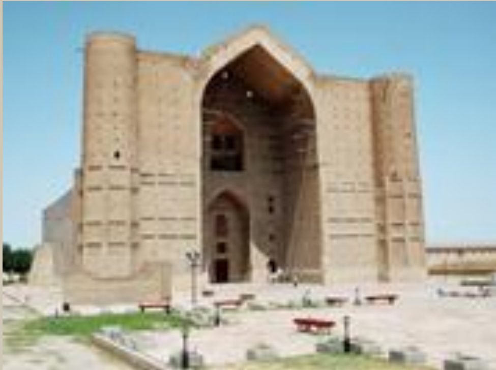
Мавзолей Ходжи Ахмеда Яссави. Туркестан (вид с фасада)