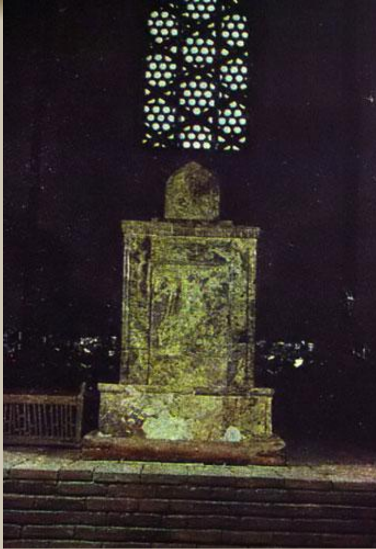
Надгробие Ходжы Ахмеда Ясави