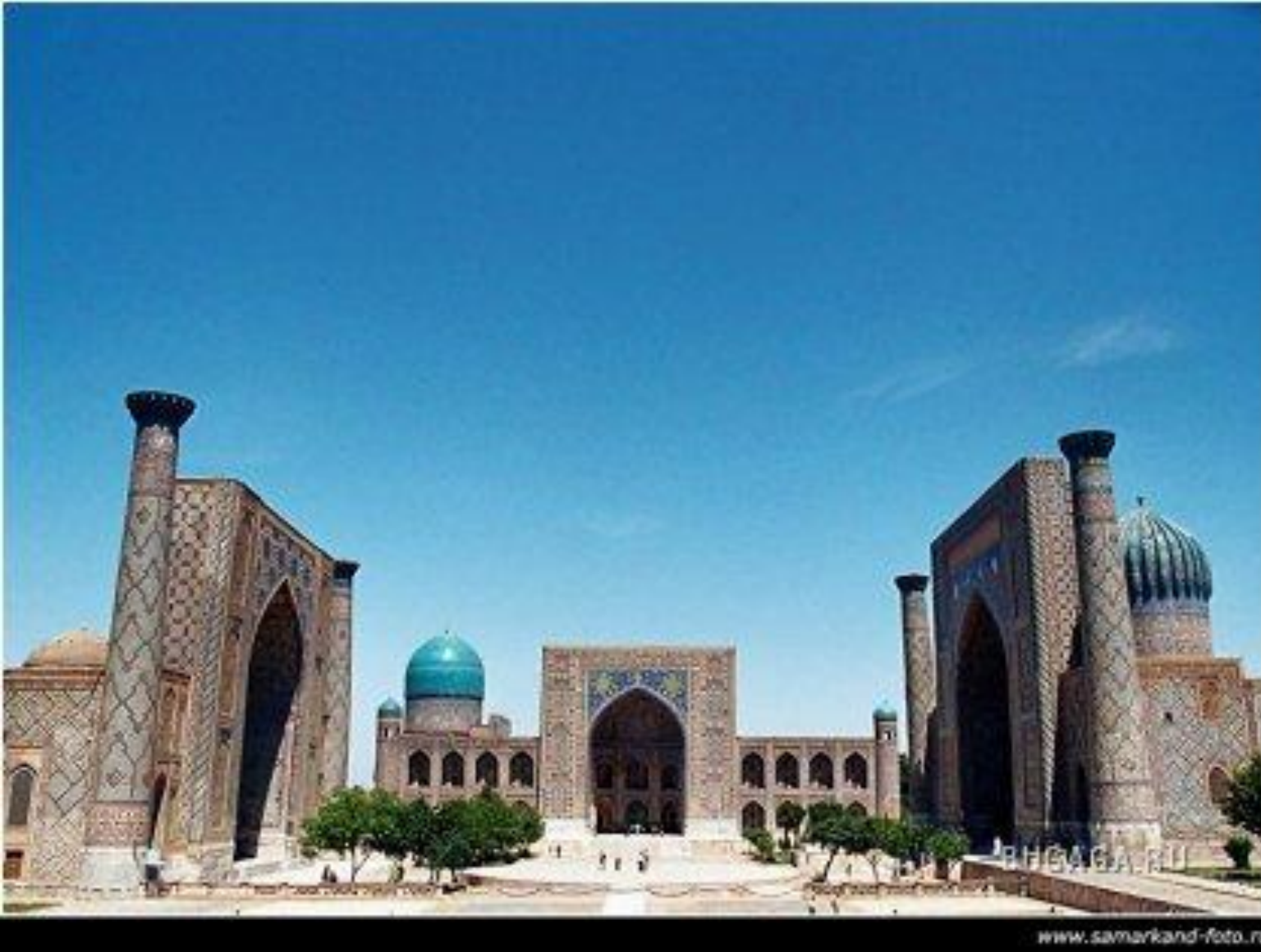
Площадь Регистан в Самарканде