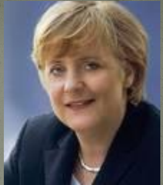
Ангела Меркель — ныне действующий канцлер Германии

Федеральный канцлер является главой Правительства Германии. Он руководит деятельностью Федерального правительства. Поэтому форму правления Германии часто ещё называют канцлерской демократией.