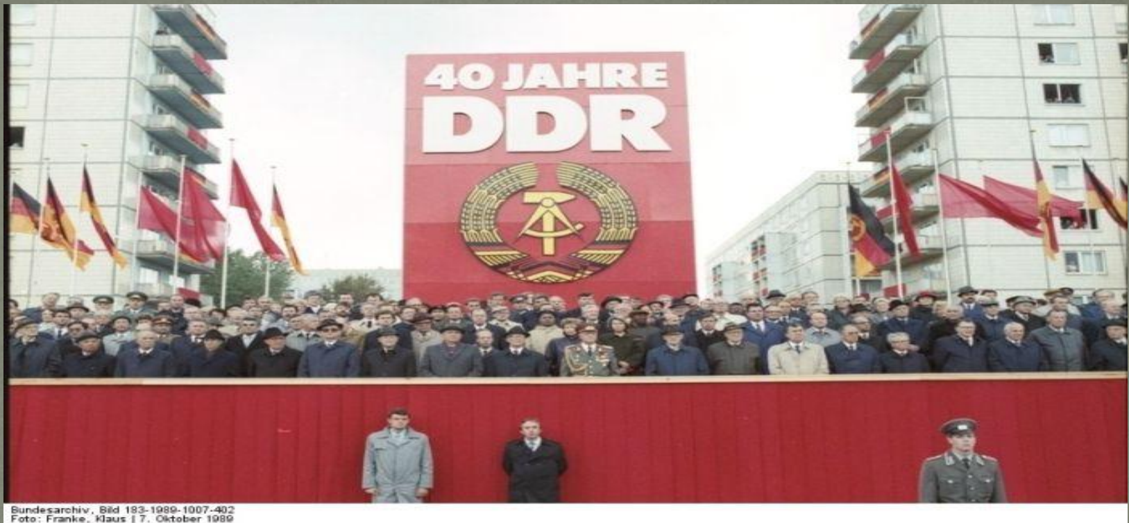
7. Oktober 1989

Германская Демократическая Республика (ГДР, Восточная Германия) — социалистическое государство, основанное 7 октября 1949 года в советской оккупационной зоне Германии и восточном (советском) секторе Берлина. Республика официально прекратила существование и была объединена с ФРГ в 00:00 по средневропейскому времени (02:00 по московскому) 3 октября 1990 года.