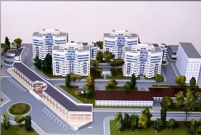
Предприятия и учреждения сферы материального производства и непроизводственной сферы любой формы собственности