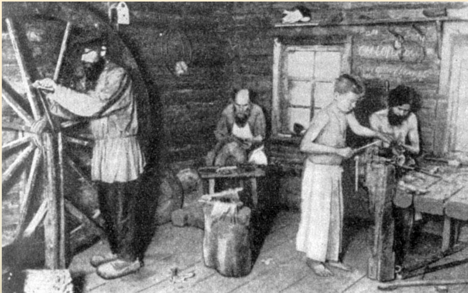
Изготовление ремесленных изделий дома