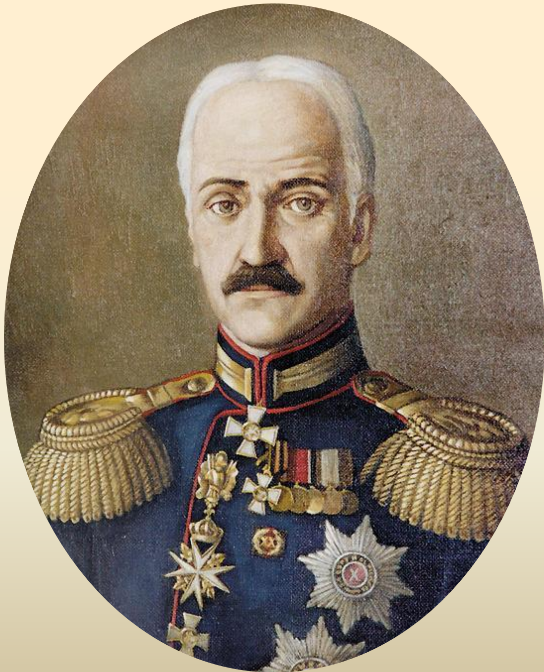
В.А. Обручев (1842-1851)