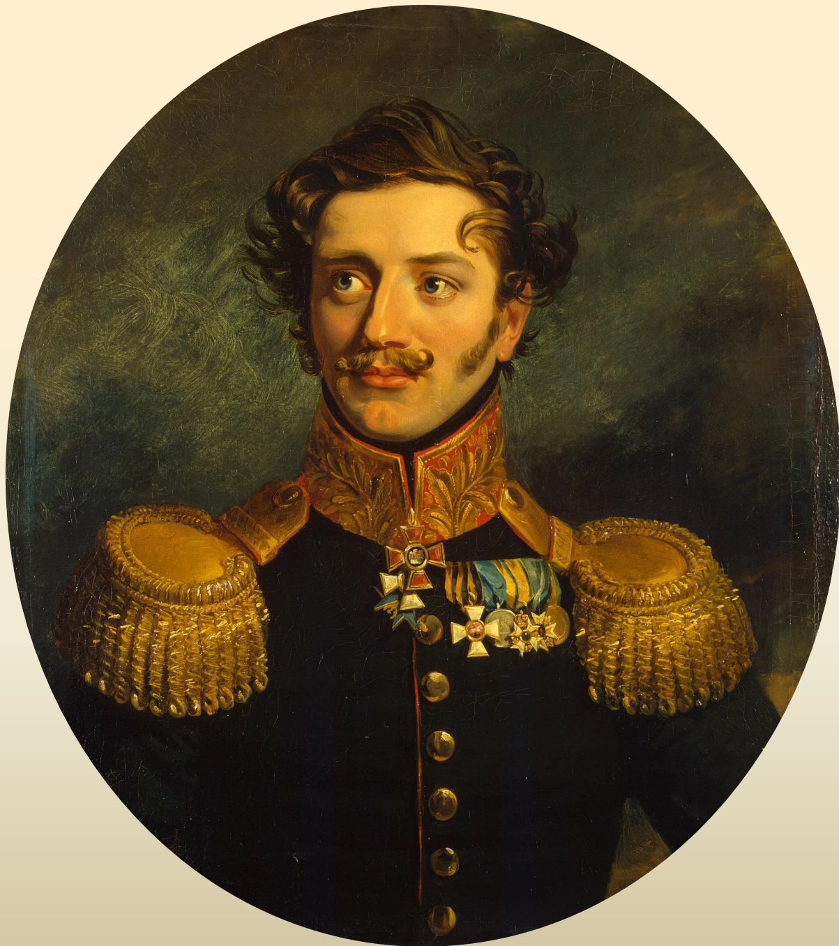
П.П. Сухтелен (1830-1833)