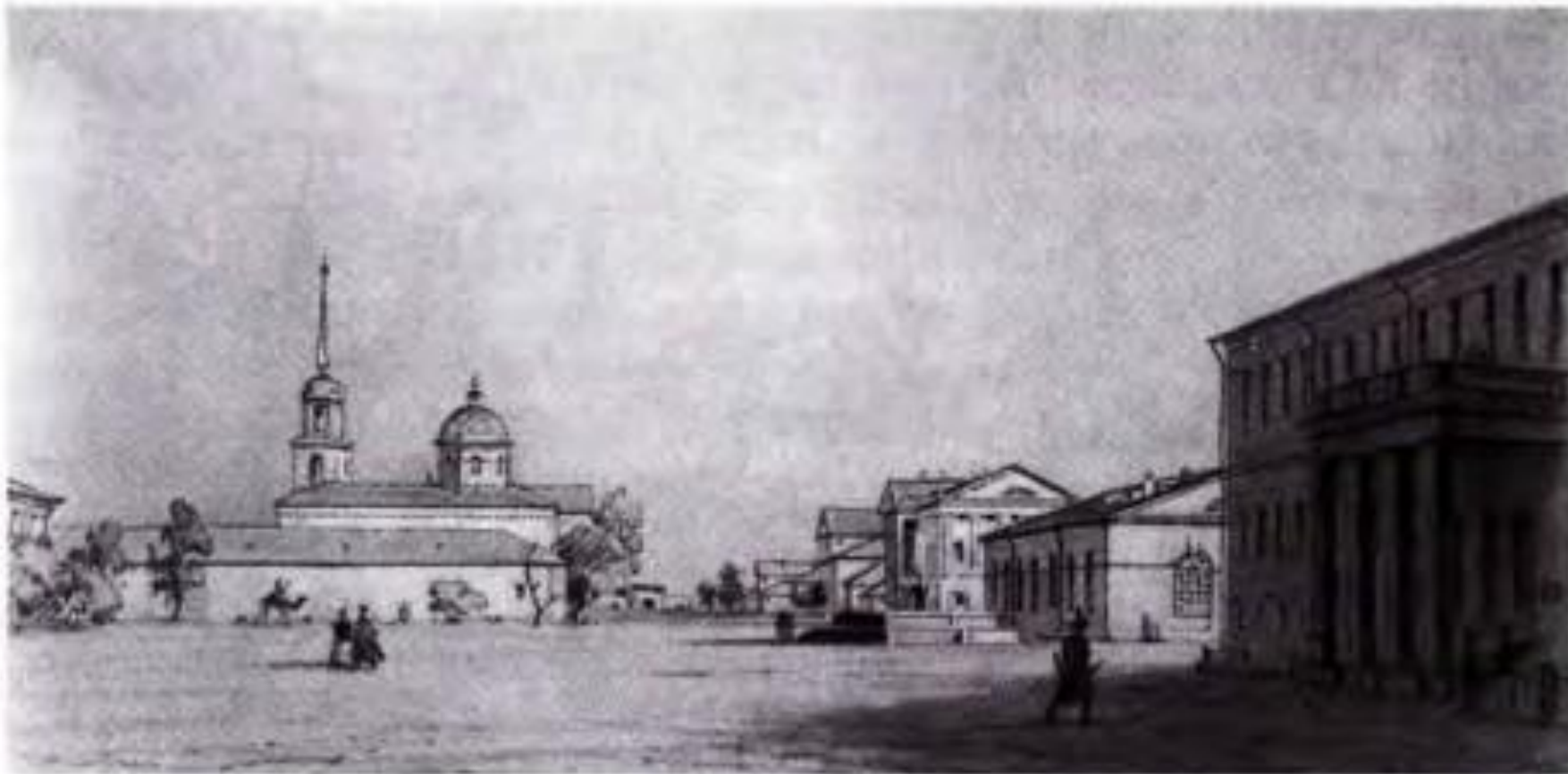
Оренбург в первой половине XIX в.

Меновой двор (мечеть, существующая и поныне)