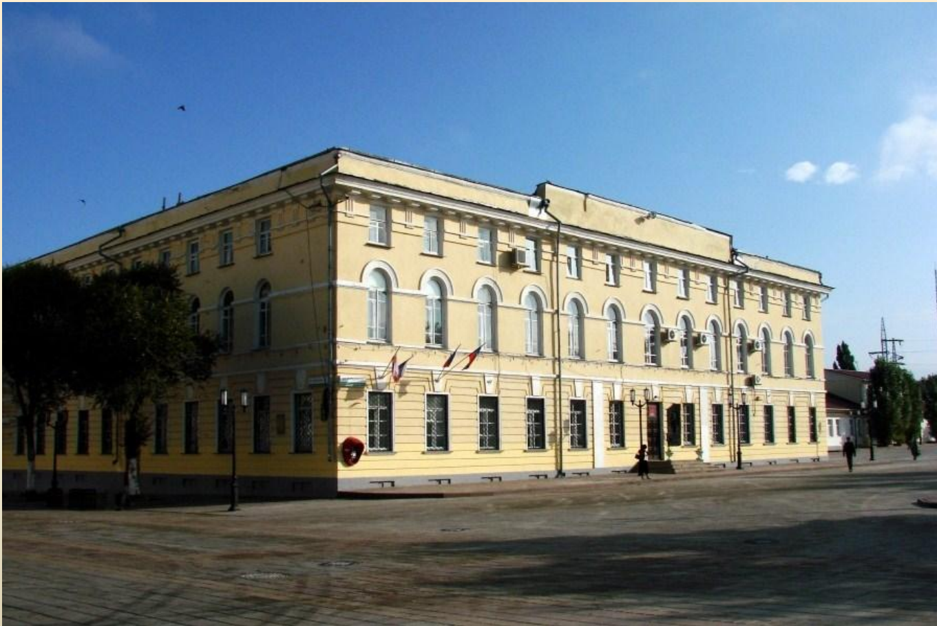
Дом военных губернаторов, ул. Советская, 2.

С 1796-1851 год губерния находилась под властью военных губернаторов. В этот период на посту оренбургского военного губернатора побывали