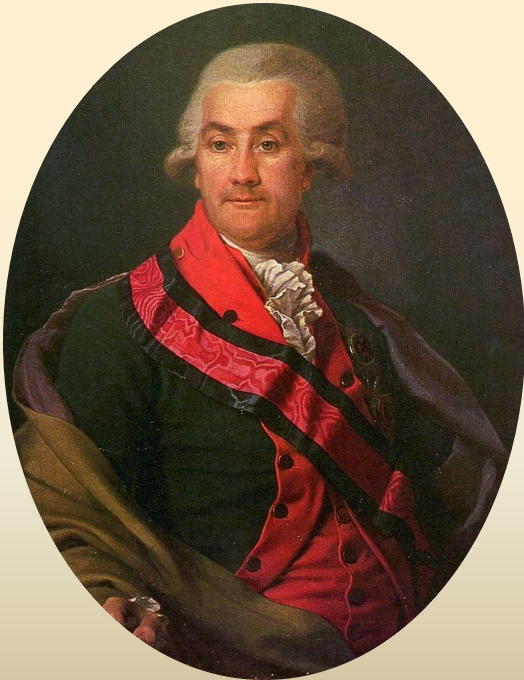
О.А. Игельстром (1796-1798)