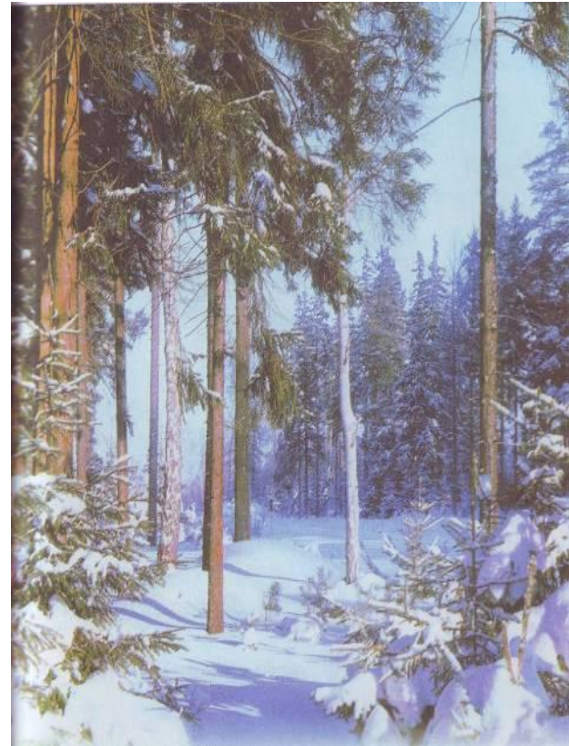
АС Пушкин «Зимнее утро».