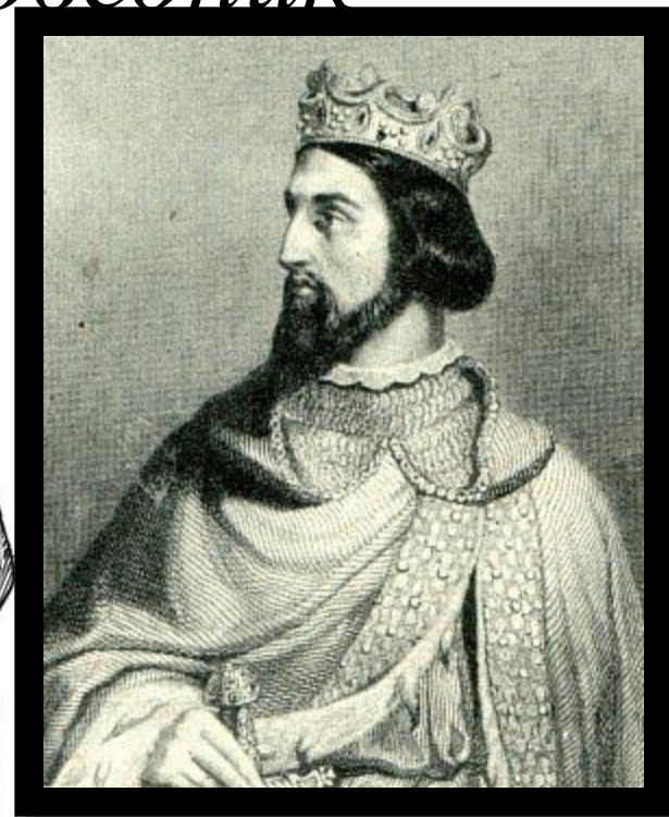
Герцог Нормандии Вильгельм