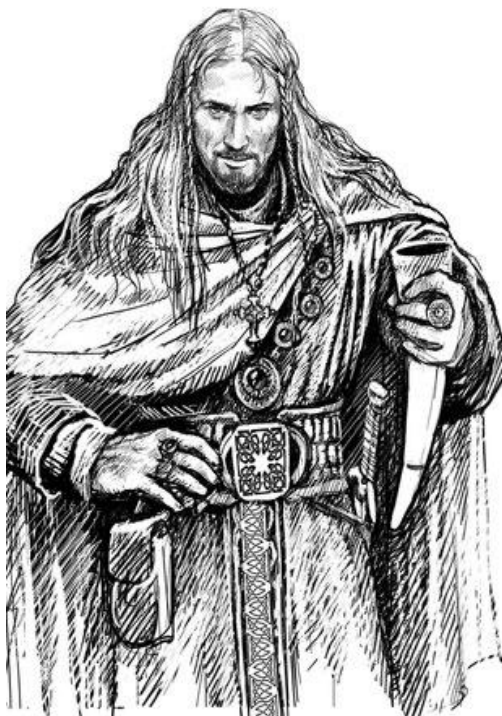
Викинг Харальд Суровый