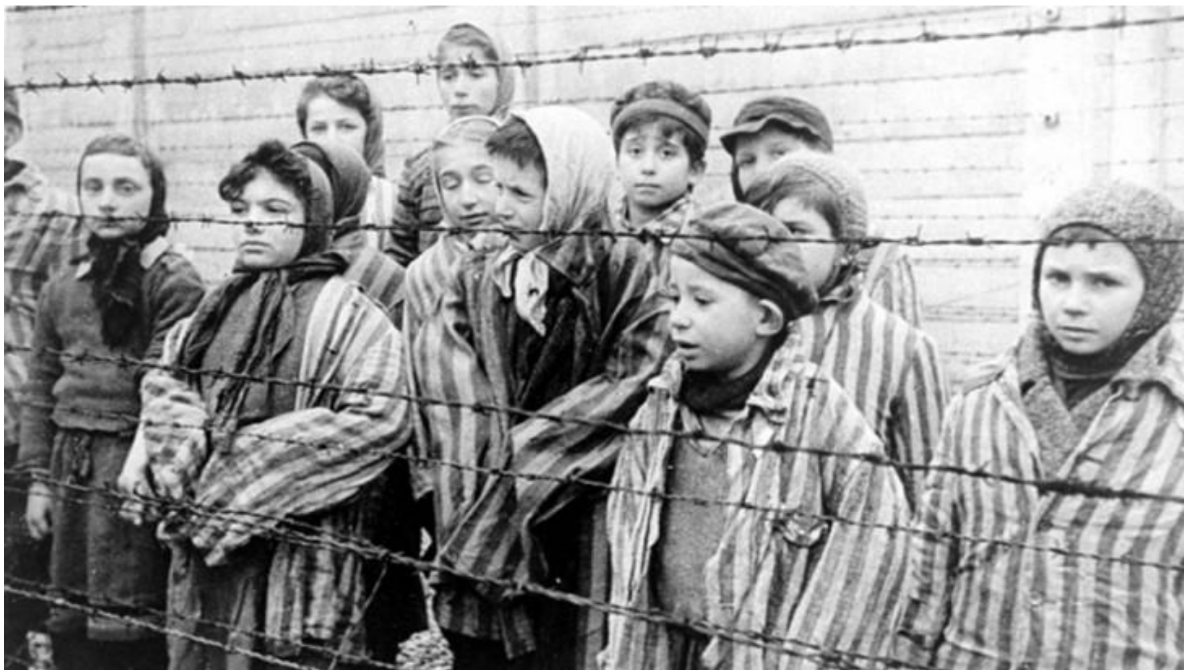
Дети, выжившие в Освенциме.