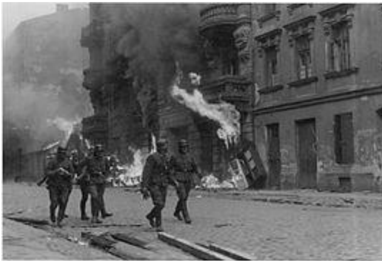
Фотография из рапорта Юргена Штропа, руководившего подавлением восстания в Варшавском гетто. Оригинальная подпись гласила: «Штурмовая группа».