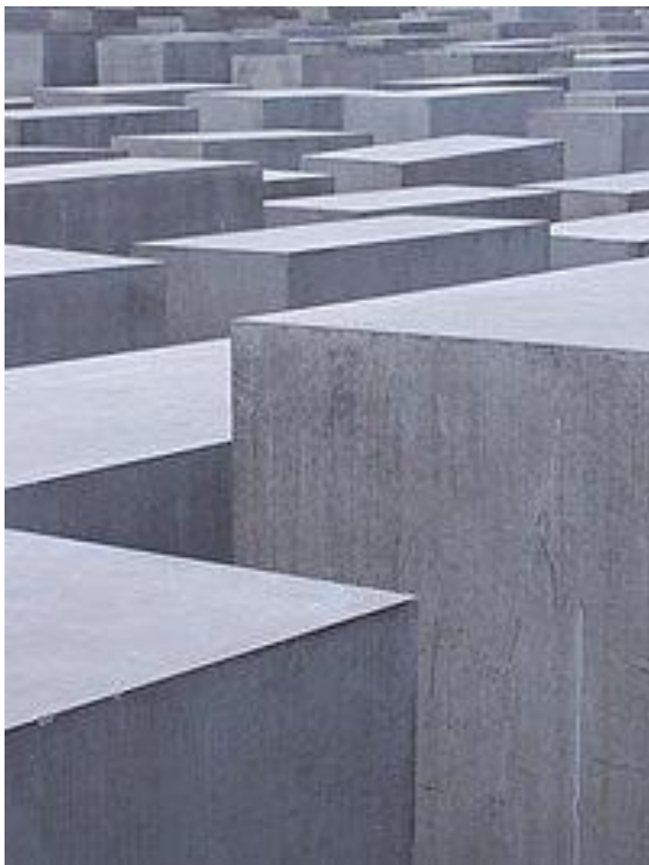
Мемориал об убитых евреях Европы в Берлине, Германия