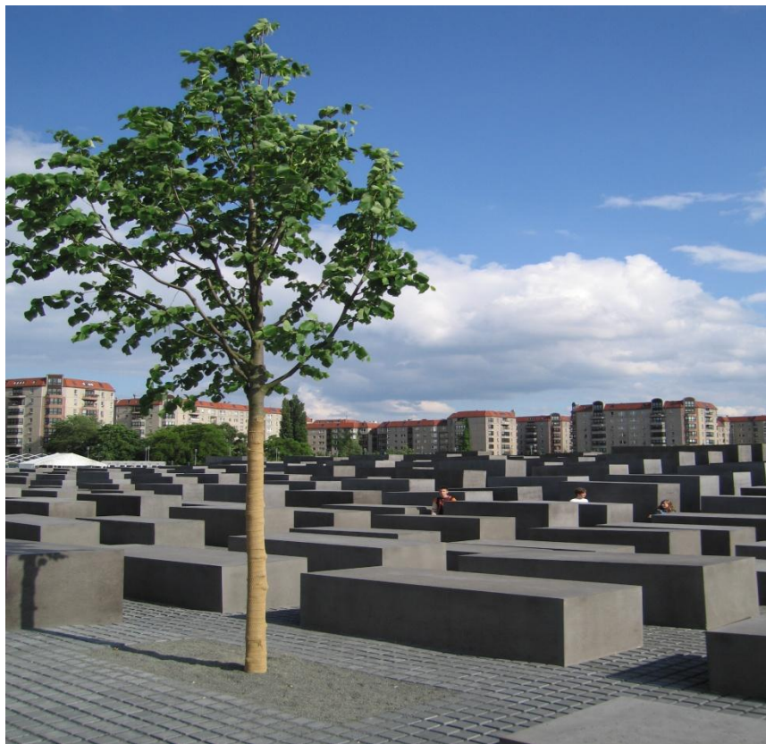
Мемориал памяти убитых евреев Европы в Берлине