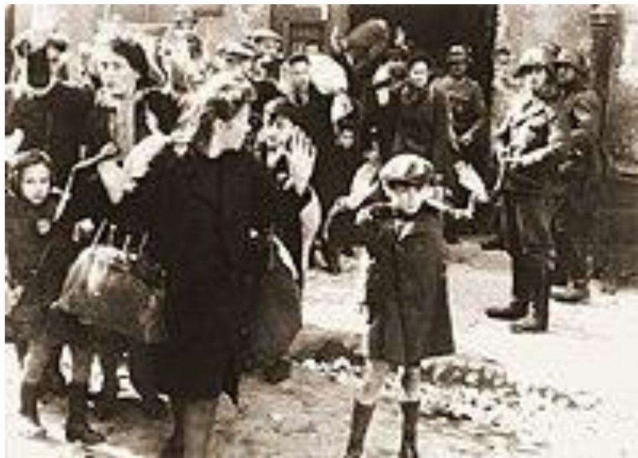
Фотография из рапорта Юргена Штропа, руководившего подавлением восстания в Варшавском гетто. Оригинальная подпись гласила: «Силой извлечённые из убежища».