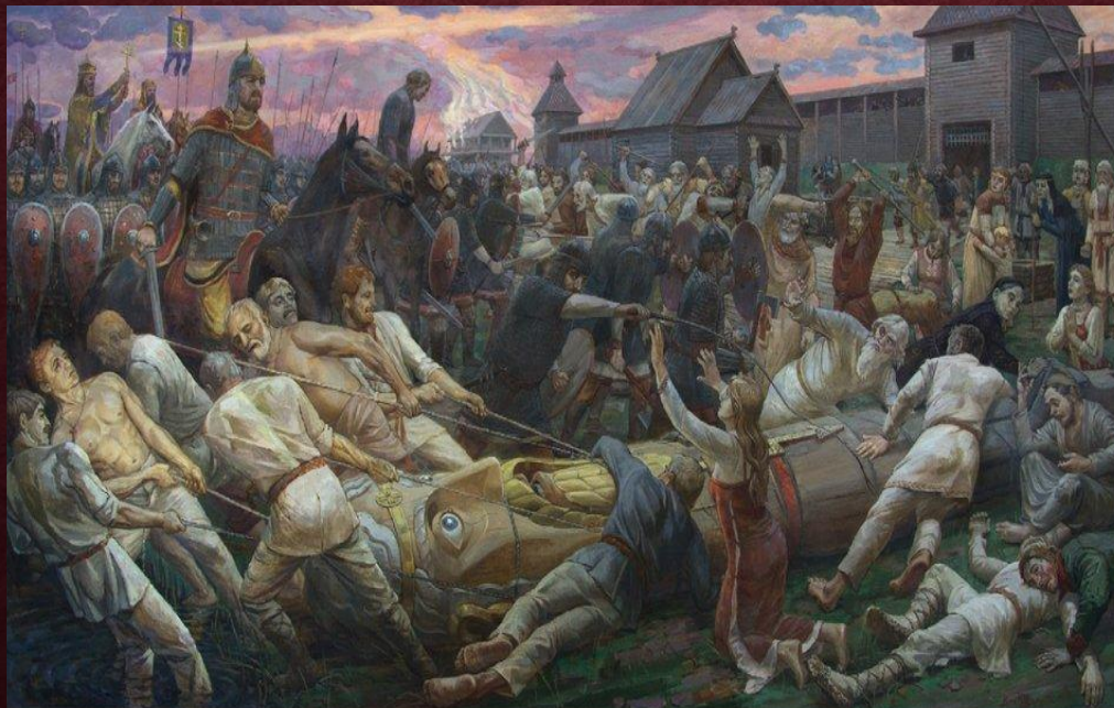
«Христианство против язычества»

Христианское духовенство пристально следило за искоренением старой веры. В результате поклонение языческим богам почти полностью исчезло из повседневной жизни.