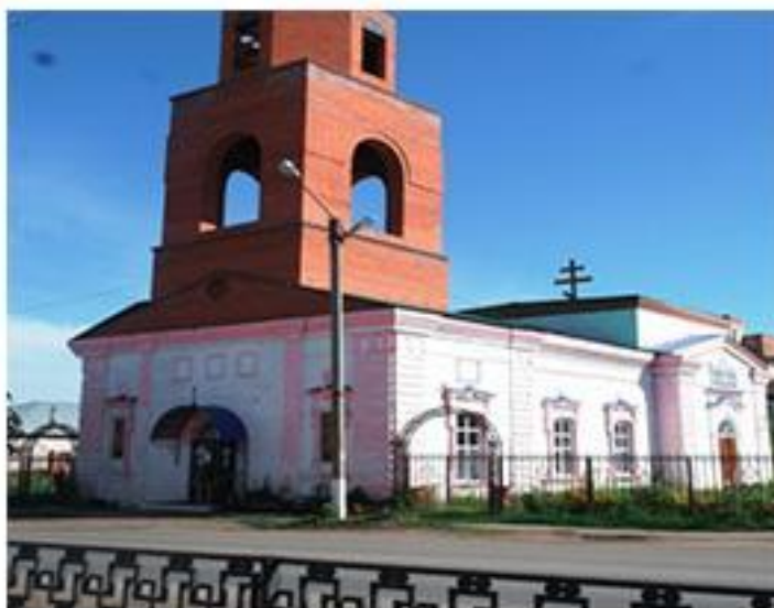
Храм Первоверховных апостолов Петра и Павла, г. Камбарка (освящен в 1889г.)

В городе Камбарка восстанавливается православный Храм Петра и Павла, которому недавно исполнилось 130 лет со дня постройки. Бог поручил людям, чтобы каждый из нас, участвуя в строительстве Храма видимого, созидал вместе с этим Храмом невидимый в душе своей.