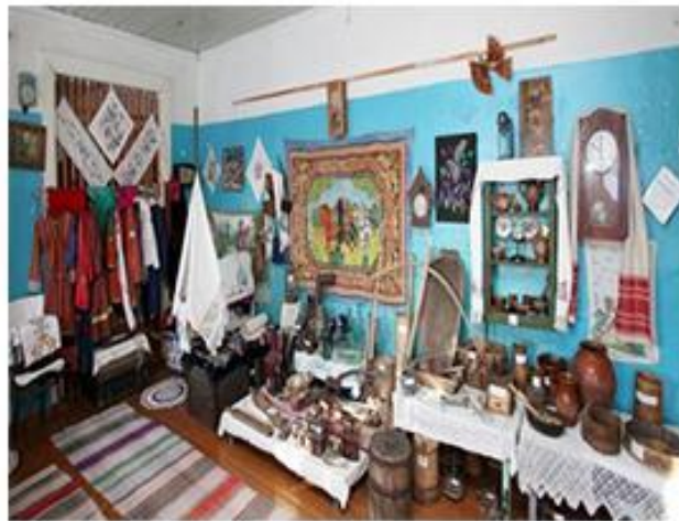
Музейная комната «Быт старообрядческой деревни» муниципального бюджетного учреждения СДК «Очаг» муниципального образования «Михайловское», открыта в 2009 г.