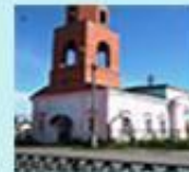
«Храм святых апостолов Петра и Павла» г. Камбарка