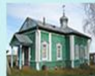
Храм святителя Никола Чудотворца Казанско-Вятской епархии РПЦ с. Балаки