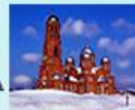
Свято-Никольский храм с. Ершовка