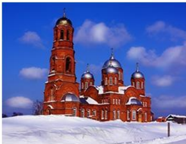
Свято-Никольский храм с. Ершовка