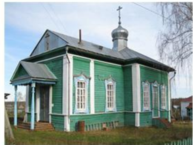
Храм святителя Николы Чудотворца Казанско-Вятской епархии РПСЦ, с. Балаки. Старообрядческая Стретенская церковь -памятник культового зодчества (1910 г.). Старинное село Балаки Камбарского района в Удмуртии издавна населяют старообрядцы. Село расположено на берегу чистой красивой речки Камбарка.