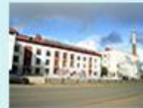
Камбарский машиностроитель- ный завод г. Камбарка