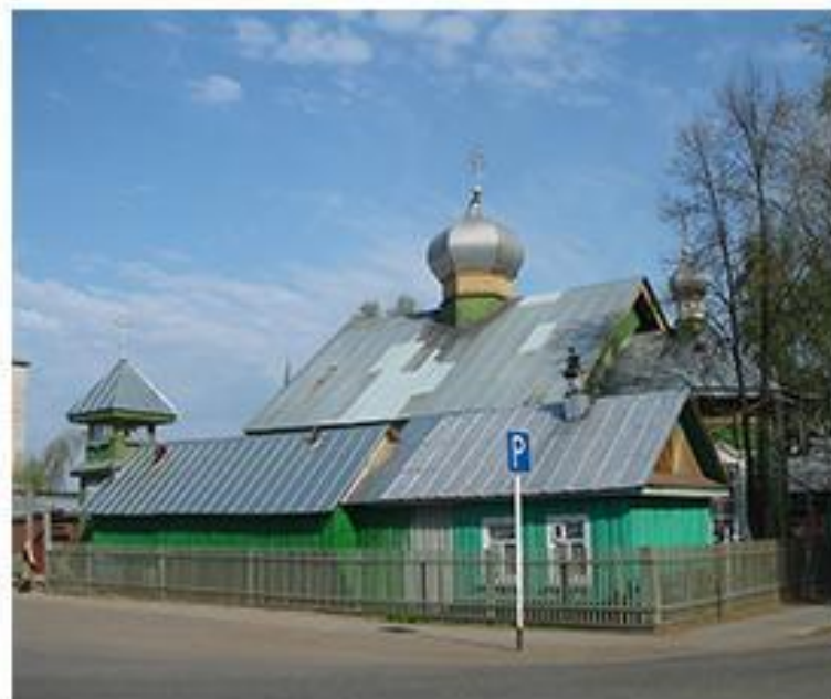
Церковь Успения Пресвятой Богородицы

В городе Камбарка восстанавливается православный Храм Петра и Павла, которому недавно исполнилось 130 лет со дня постройки. Бог поручил людям, чтобы каждый из нас, участвуя в строительстве Храма видимого, созидал вместе с этим Храмом невидимый в душе своей.