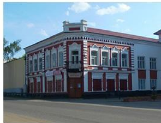
Дома купцов Вавиловых.

Дом купца Дмитрия Ширшова был построен в 1890 году. Перед революцией купец разорился, и в 1909 году продал свой дом-особняк Камбарскому волостному правлению для женского училища. С 1909 года в этом здании находилось Камбарское земское женское училище. В 1913 году здание школы расширилось за счет одноэтажного пристроя.