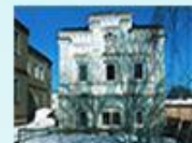
Флигель купца Кондорина г. Камбарка