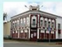
Дом купца Вавилова г. Камбарка