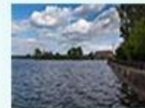
Камбарский пруд г. Камбарка