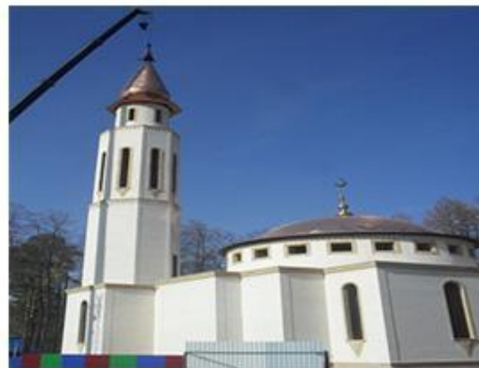
Мечеть общины мусульман с. Кама

Музейная комната «Культура и быт татар 40-50-х гг. прошлого столетия» в библиотеке муниципального бюджетно- го учреждения «Камский культурно-би- блиотечный центр», открыта в 2001 г.