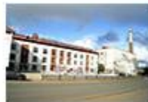
Камбарский машиностроитель- ный завод г. Камбарка