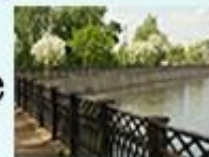
Камбарская плотина г. Камбарка