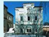
Флигель купца Кондорина г. Камбарка