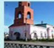
«Храм святых апостолов Петра и Павла» г. Камбарка