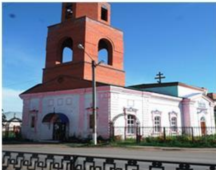
Храм Первоверховных апостолов Петра и Павла, г. Камбарка (освящен в 1889г.)

В городе Камбарка восстанавливается православный Храм Петра и Павла, которому недавно исполнилось 130 лет со дня постройки. Бог поручил людям, чтобы каждый из нас, участвуя в строительстве Храма видимого, созидал вместе с этим Храмом невидимый в душе своей.