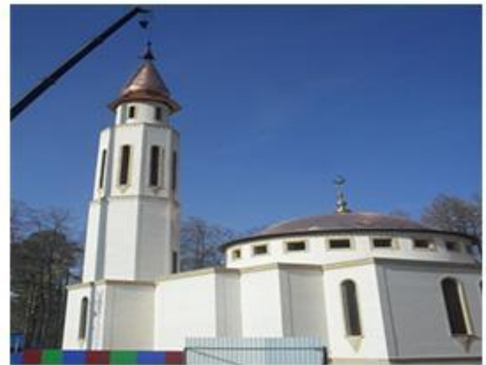
Мечеть общины мусульман с. Кама

Музейная комната «Культура и быт татар 40-50-х гг. прошлого столетия» в библиотеке муниципального бюджетно- го учреждения «Камский культурно-би- блиотечный центр», открыта в 2001 г.