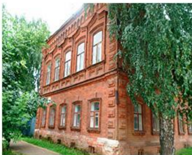
Дом купца Ширшова.

Дом купца Дмитрия Ширшова был построен в 1890 году. Перед революцией купец разорился, и в 1909 году продал свой дом-особняк Камбарскому волостному правлению для женского училища. С 1909 года в этом здании находилось Камбарское земское женское училище. В 1913 году здание школы расширилось за счет одноэтажного пристроя.