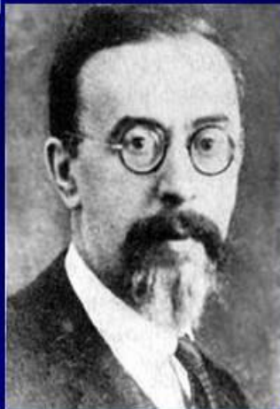
Семён Людвигович Франк

Смысл жизни выводится за рамки как индивида, так и жизни в целом и основан на абсолютных ценностях ( Боге, Идее )