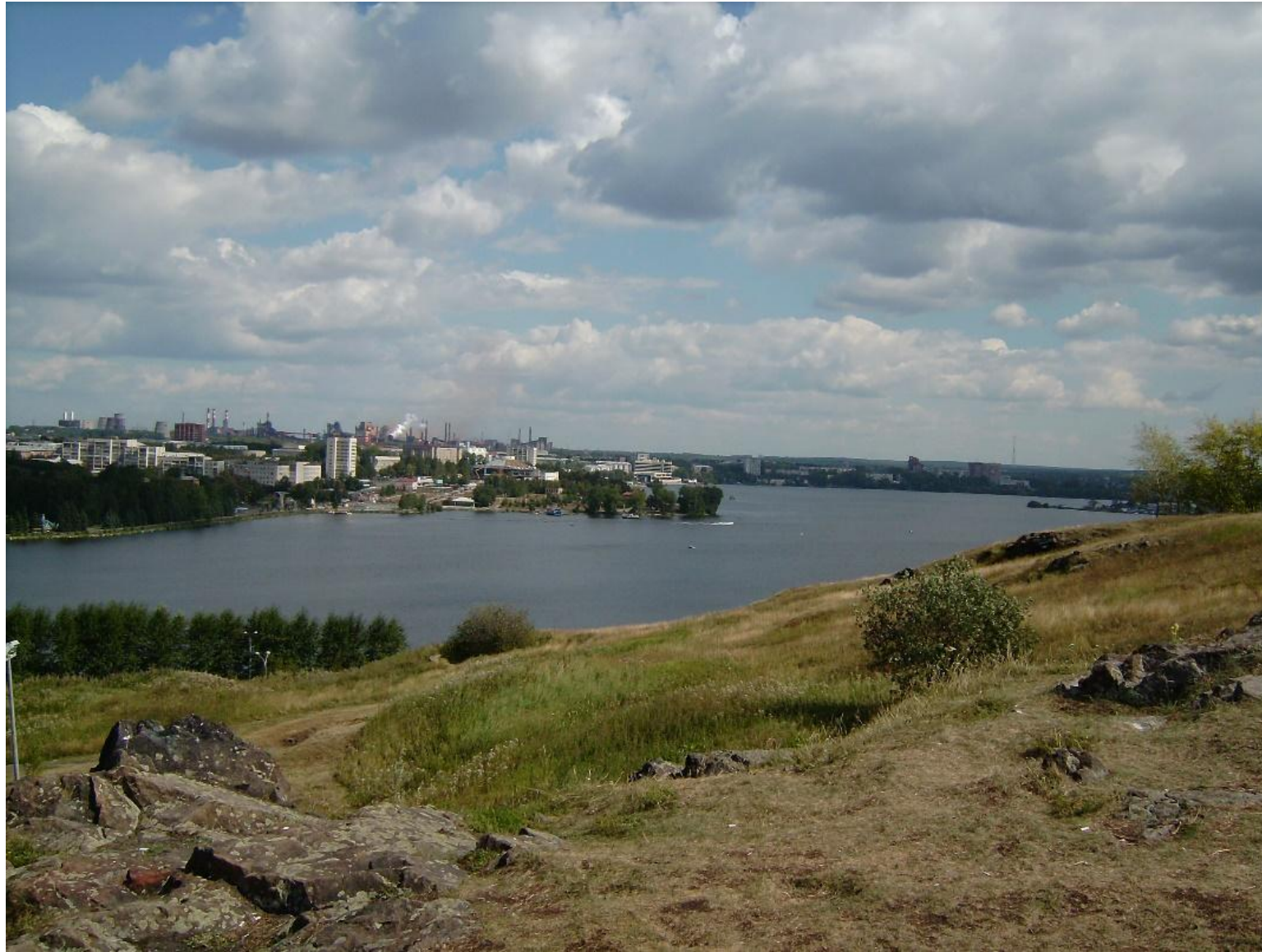
С Лисьей горы открывается прекрасный вид на город.