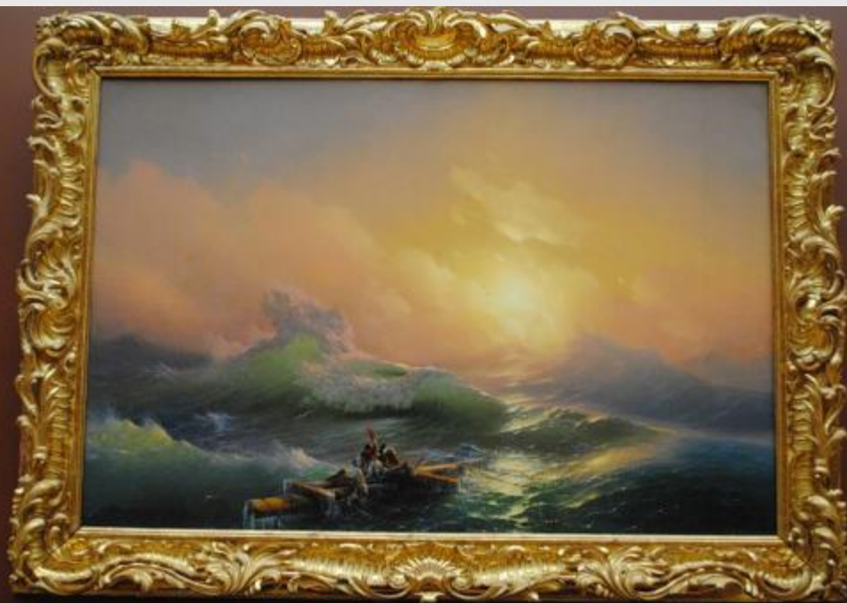
К. Айвазовский «Девятый вал»