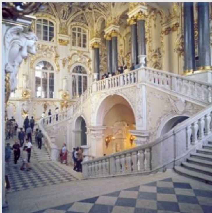
Знаменитая Иорданская лестница

В музее расположено 300 экспозиционных залов