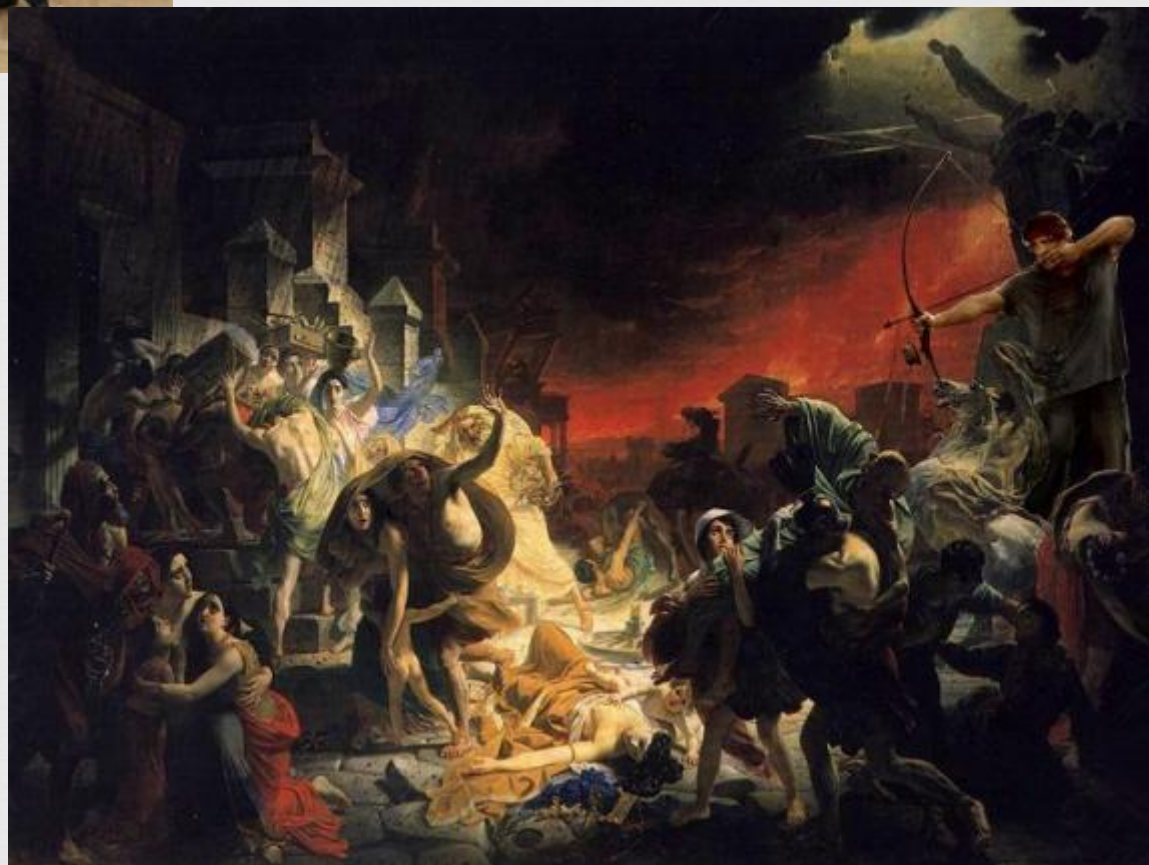
К. Брюллов «Последний день Помпеи»