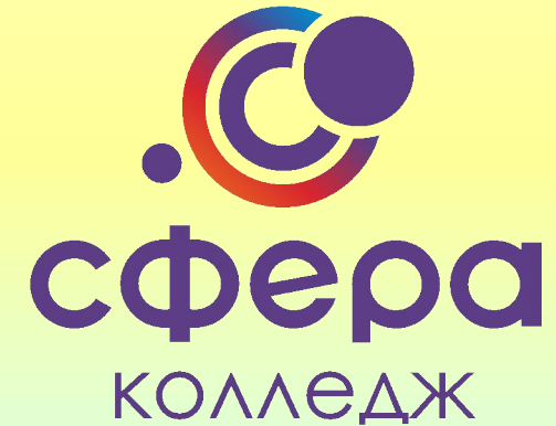
ГРАФИК РАБОТЫ ПРИЕМНОЙ КОМИССИИ: Пн.-Пт.: с 9-00 до 16-00, Сб. с 9-00 до 14-00, Вс. - выходной (*на мобильные телефоны в будние дни можно позвонить до 17:00).

ТЕЛЕФОН: 8 (351) 397-55-87, 8-919-315-83-37