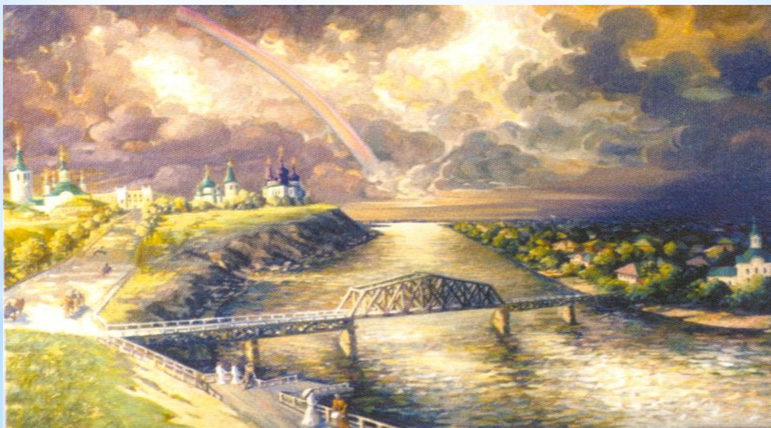
Вид Тюмени в XIX в.

Торгово-промышленным центром являлась Тюмень. Находясь на пересечении торговых путей между Западом и Востоком, Тюмень превратилась в "ворота Сибири". Через Тюмень проходил путь переселенцев из Европейской части Росси после отмены крепостного права и в годы Столыпинской аграрной реформы.