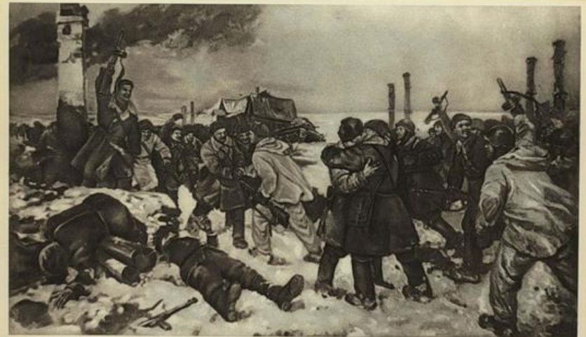
Встреча войск Ленинградского и Волховского фронтов