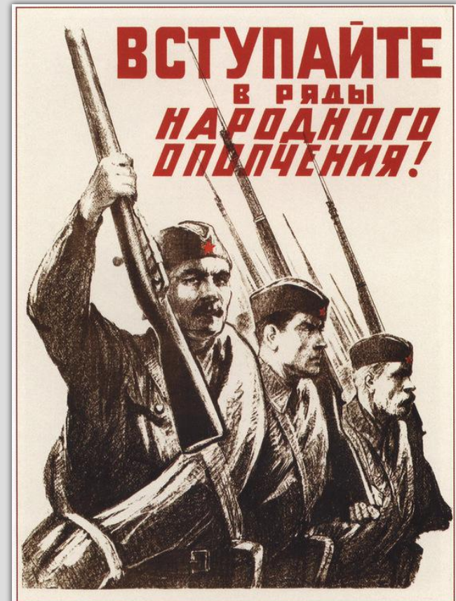
284. Ситтаро А. Вступайте в ряды народного ополчения! 1941