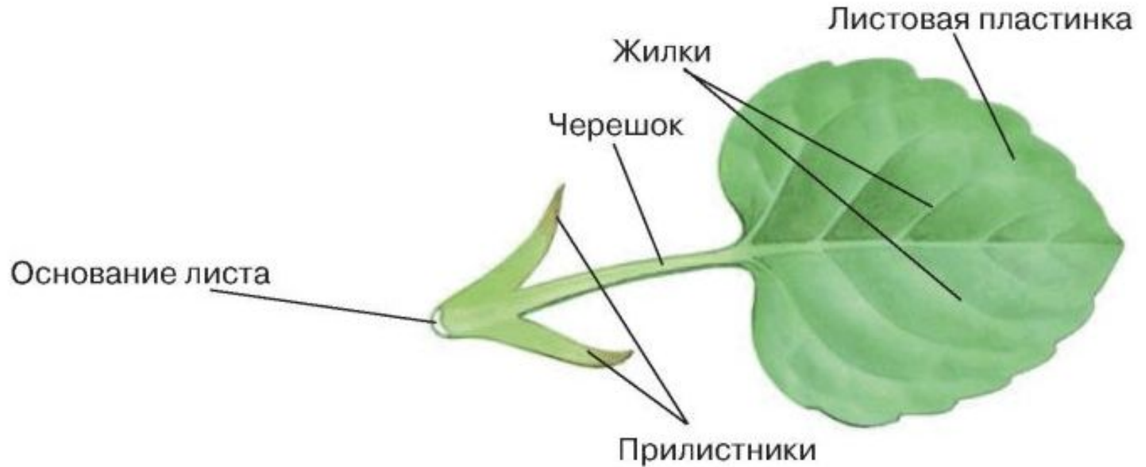
Внешнее строение листа