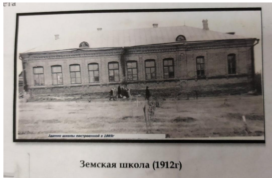
Земская школа (1912г)