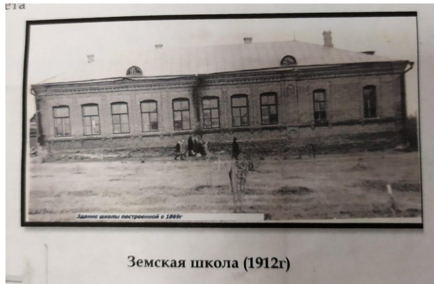
Земская школа (1912г)