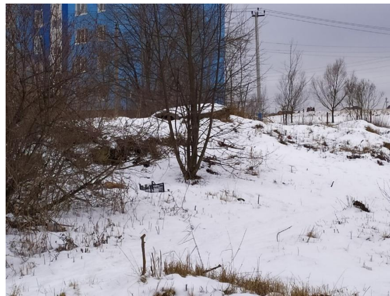
Остаток фундамента от старой школы