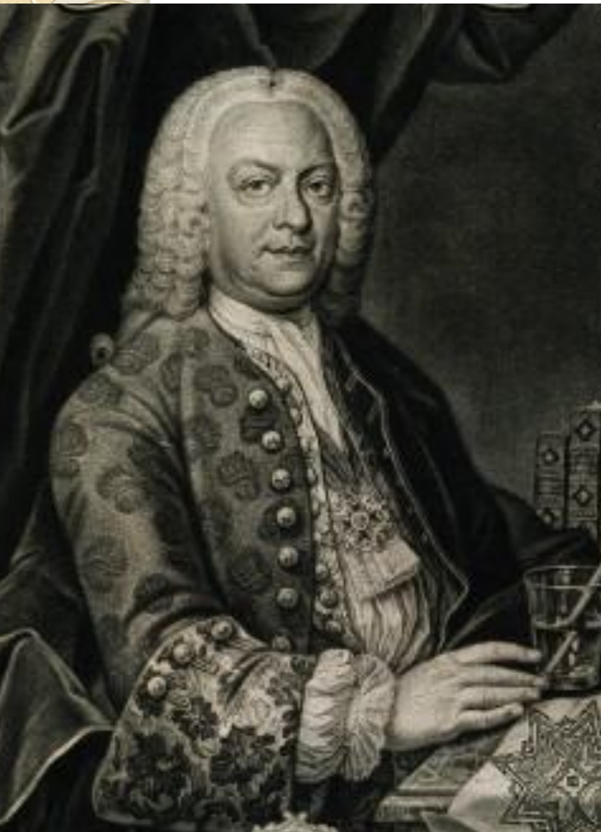
Жан Батист Валлен- Деламот (1729-1800)