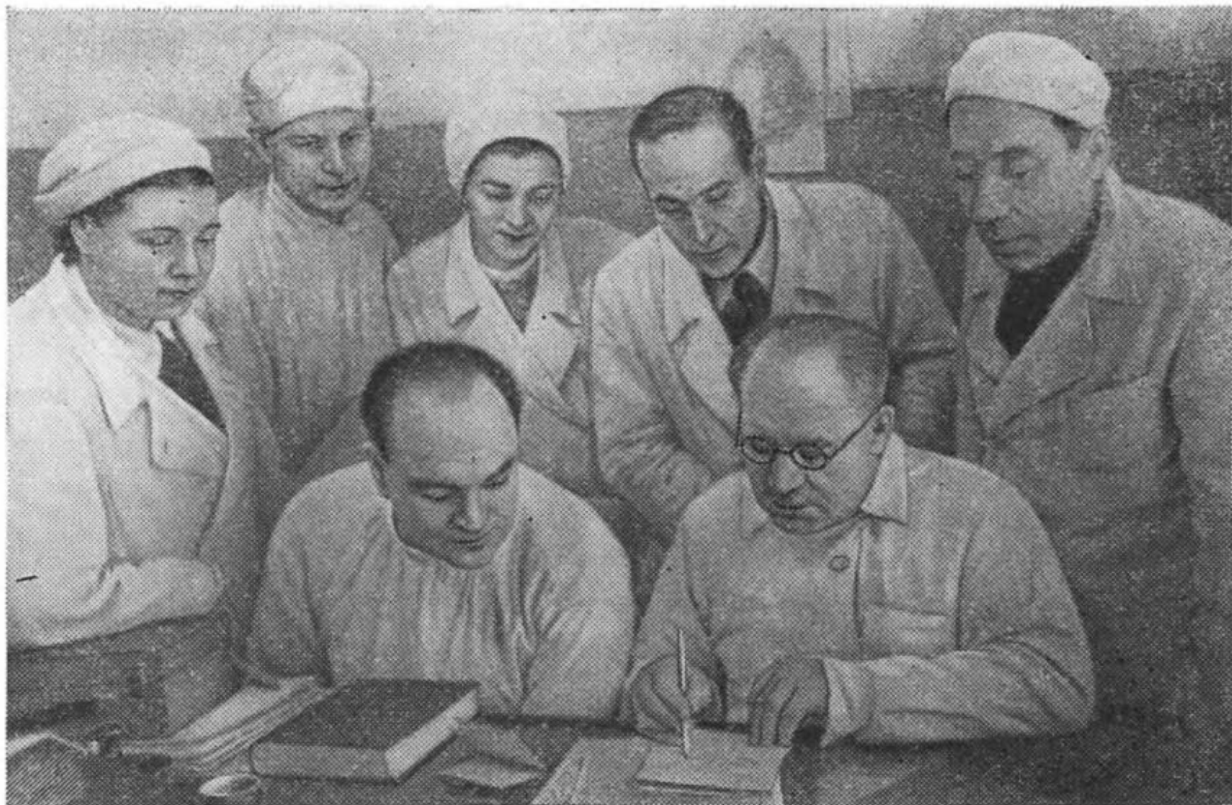
И. И. Бурденко среди своих учеников-нейрохирургов.