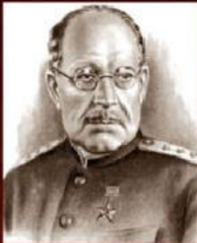
Бурденко Николай Нилович , хирург, основоположник российской нейрохирургии