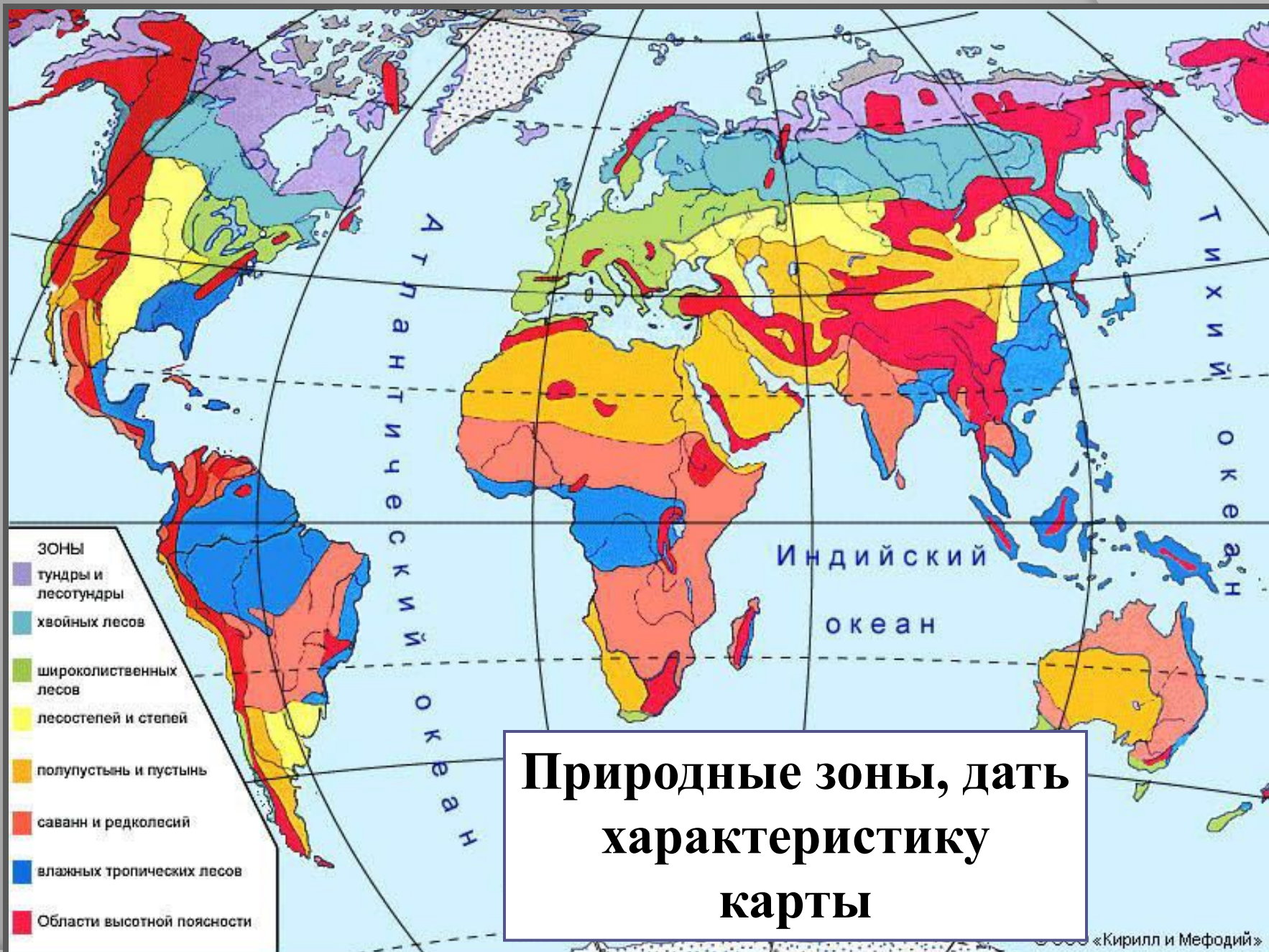
Основные биомы суши. Географическая карта.