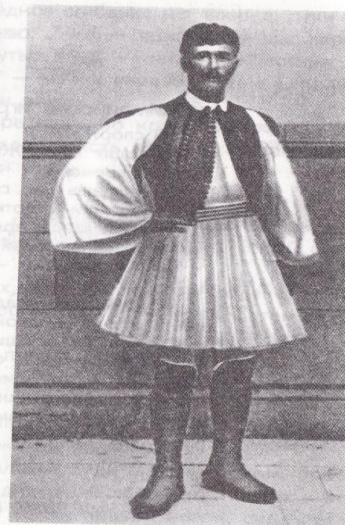
Греческий бегун Спирос Луис — победитель в марафоне на Играх I Олимпийских