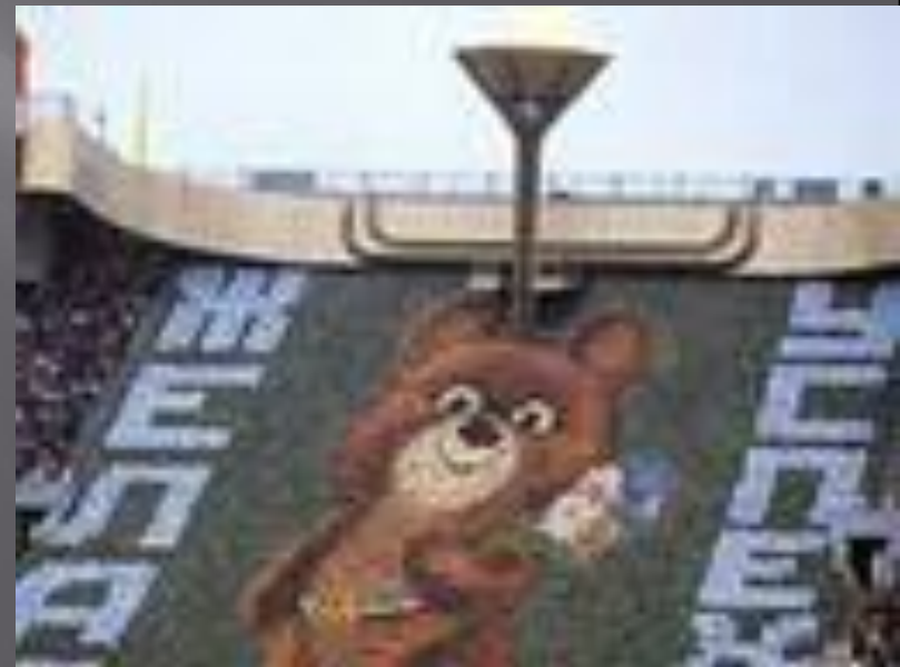
Олимпийский медвежонок «МИША»

В них приняли участие 8304 спортсмена из 81 страны. На играх в Москве было установлено 36 мировых рекордов. Но запомнились они не только победами и рекордами. На спортивных аренах царила настоящая атмосфера дружбы