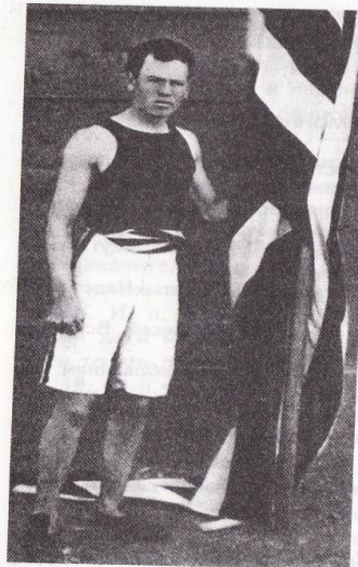
Чемпион Олимпийских игр 1896 г. атлет из США Джеймс Конноли (тройной прыжок) —

В программу игр входили греко-римская борьба, велосипедный спорт, гимнастика, лёгкая атлетика, плавание, стрельба, теннис, тяжёлая атлетика, Фехтование. Первым олимпийским чемпионом стал американец Джеймс Конноли. Главным номером программы стал марафонский бег по дороге от Деревни Марафон до Афин. Первым финишировал грек Спирос Луис, ставший после этого успеха национальным героем.