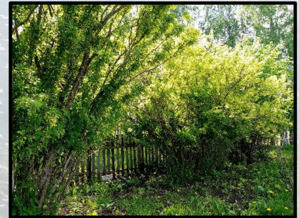
«Зеленая семья; кусты теснятся»