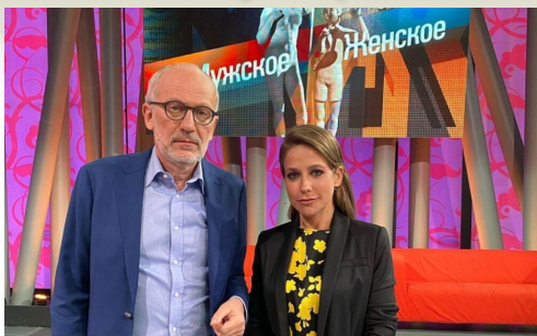
Юлия Барановская и Александр Гордон

В программе не занимает ничью сторону, не находит никому оправданий.