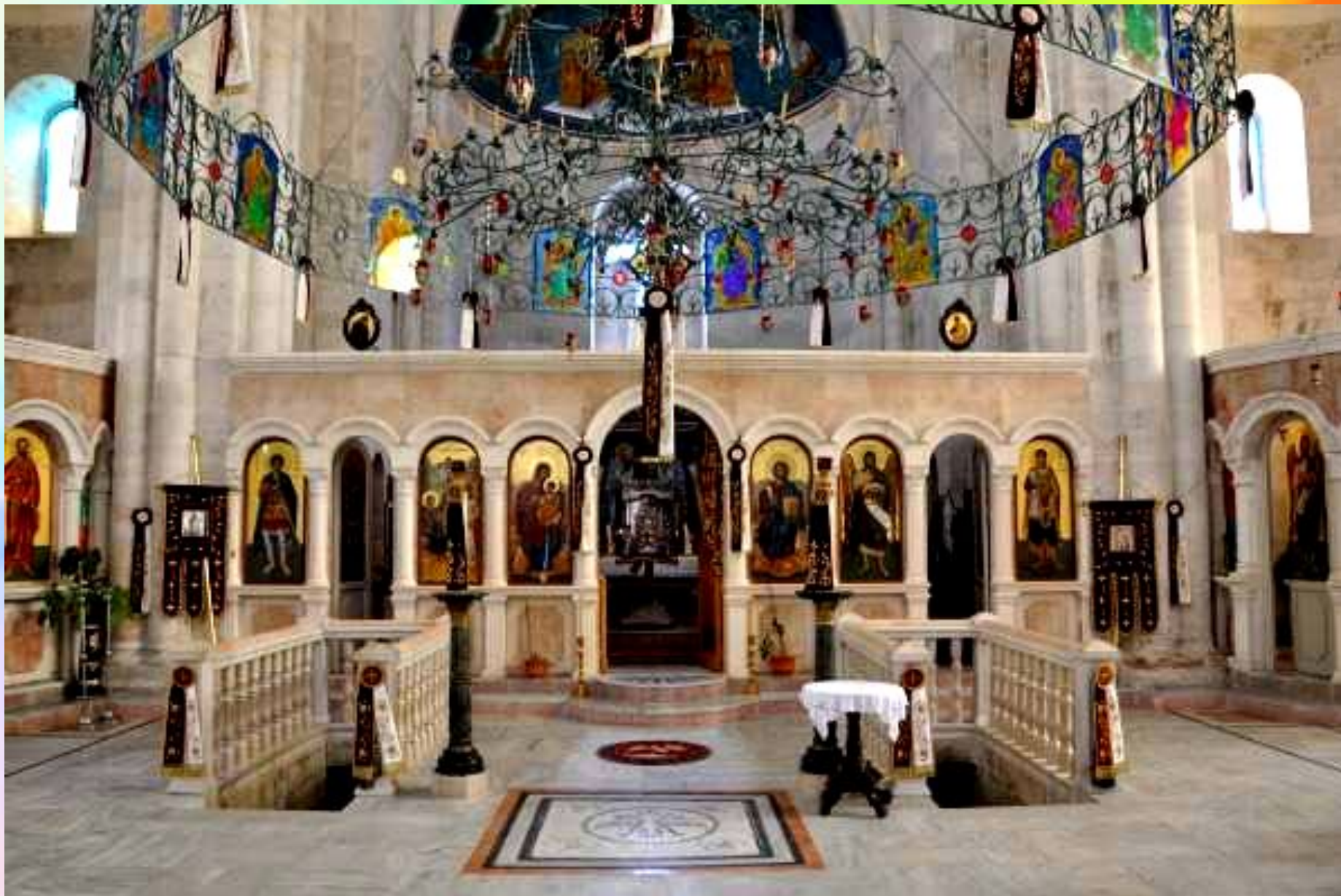
фото места Нагорной проповеди сегодня (Капернаум)