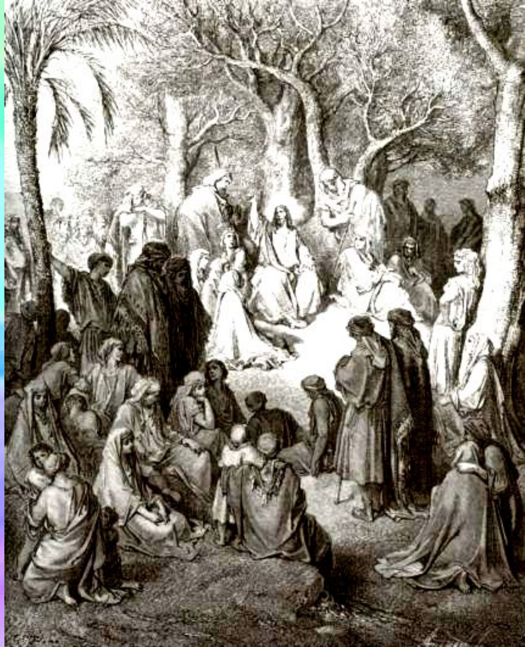
Г.Доре «Нагорная проповедь»