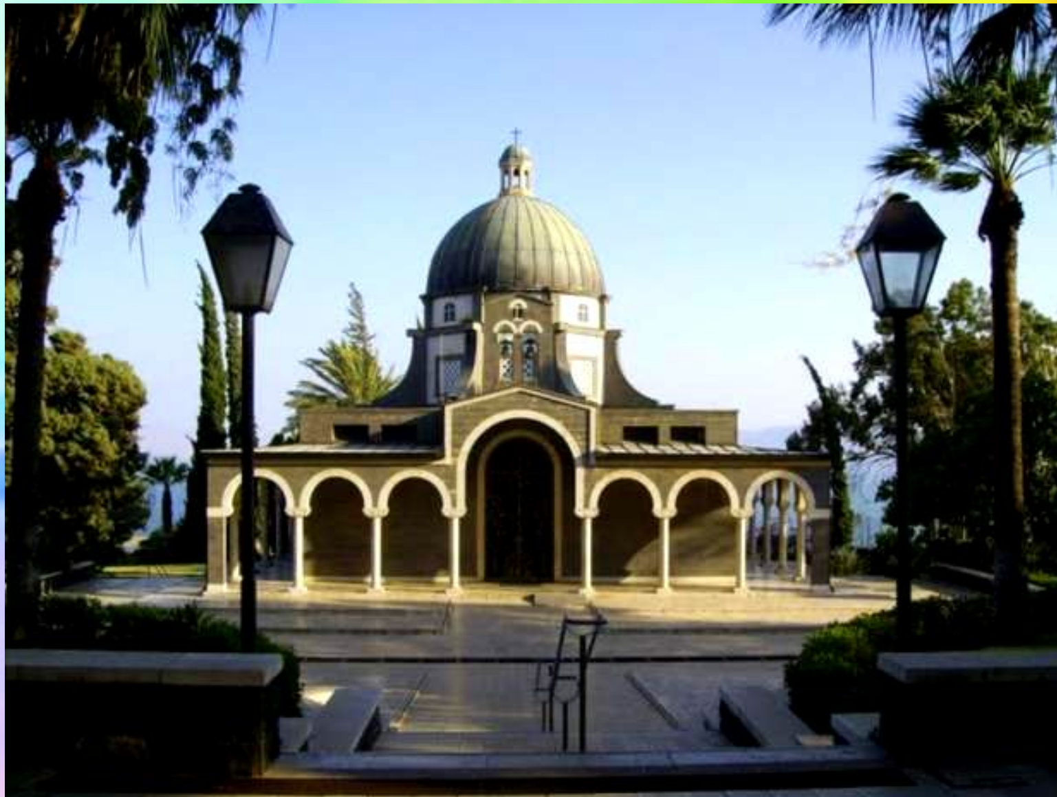
Церковь на месте, где Христос произнес Заповеди блаженства