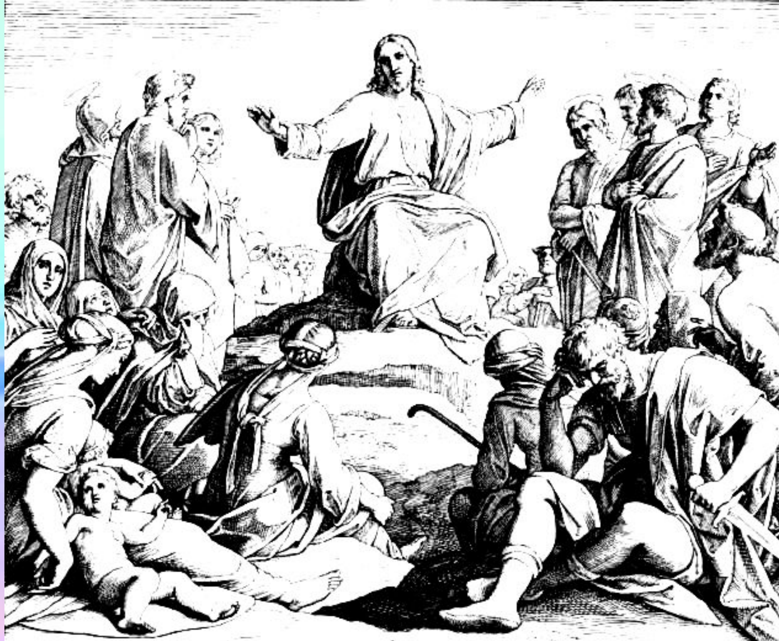
Ю.Карольсфельд «Нагорная проповедь»