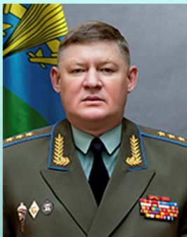
Командующий Воздушно-десантными войсками Генерал-полковник Сердюков Андрей Николаевич