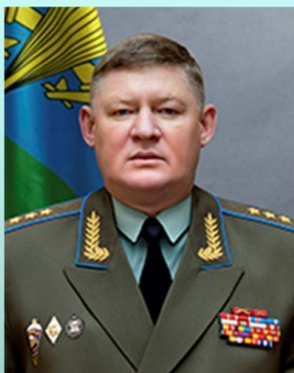
Командующий Воздушно-десантными войсками Генерал-полковник Сердюков Андрей Николаевич