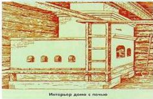
Интерьер дома с печью

Постройки В конце XIX — начале XX в. состоятельные чувашки начинают строить большие дома с богатой резьбой. В чувашских деревнях появляются русские плотники. Работая с ними в качестве помощников, чувашские плотники приобщались к "секретам" русских мастеров. В целом ремесло и домашнее производство у чувашей имели натуральный характер