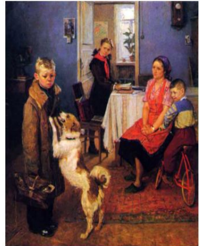
«Опять двойка». Художник Ф. П. Решетников