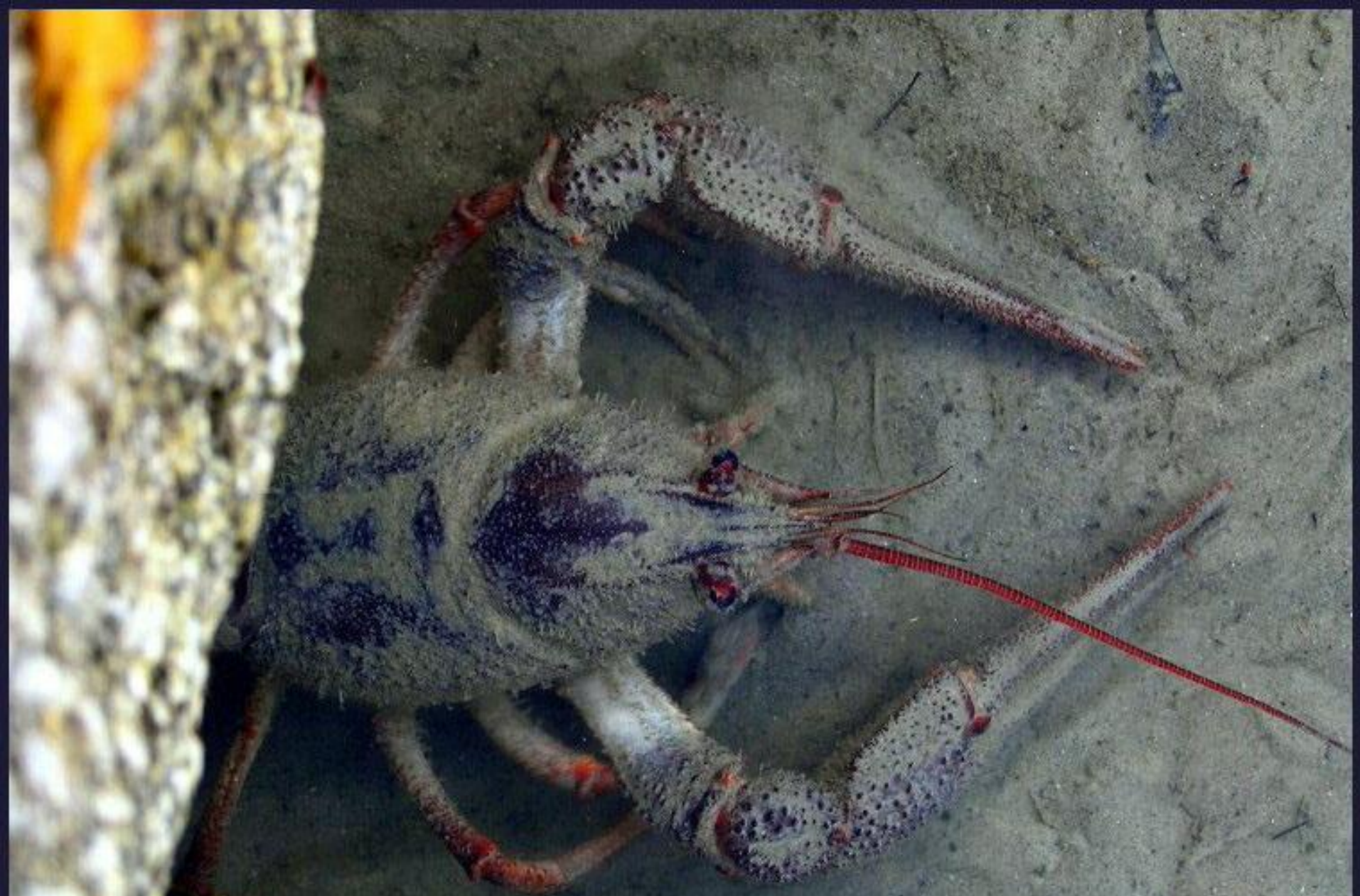
Под корягой рак,