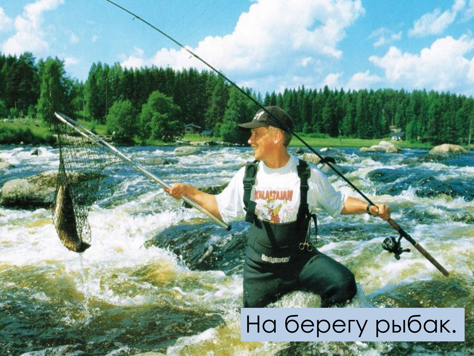
На берегу рыбака.