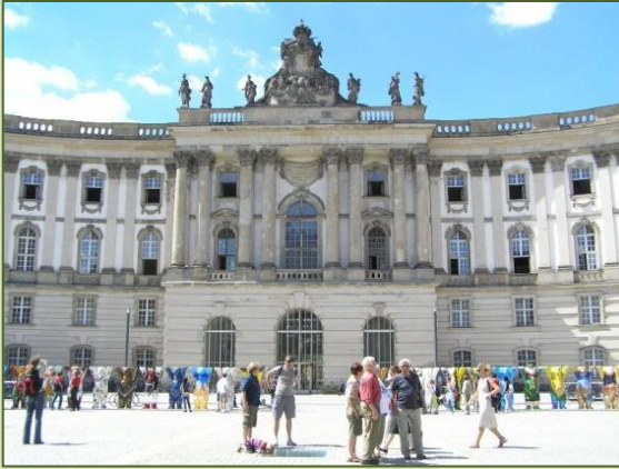
die Königliche Bibliothek