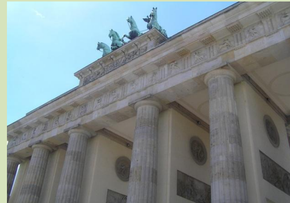
das Brandenburger Tor