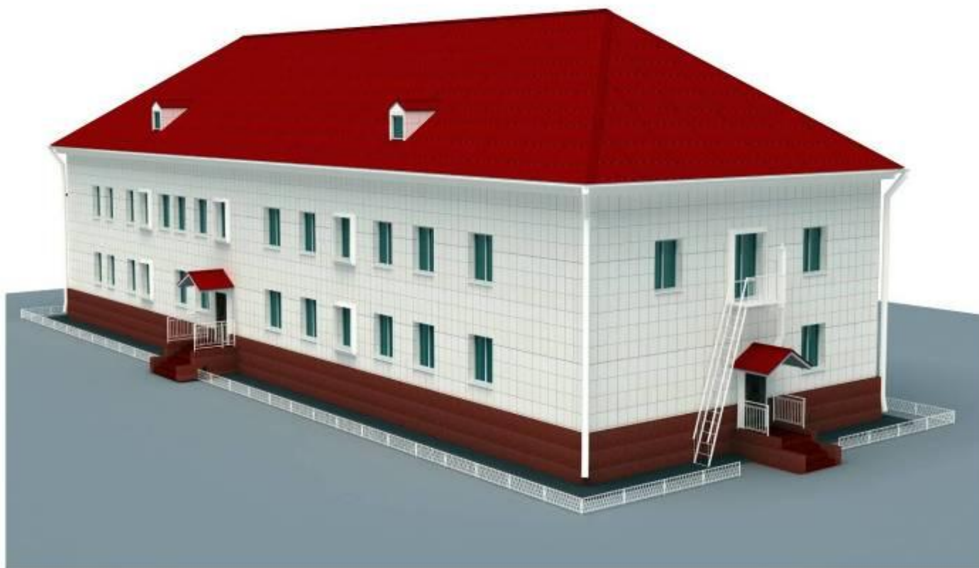
ПЕРСПЕКТИВА ТОРЦЕВОГО ФАСАДА