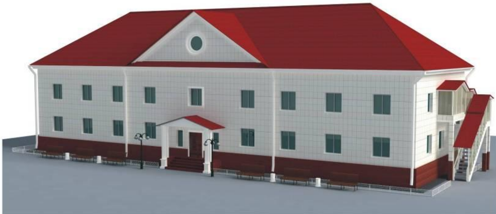
ПЕРСПЕКТИВА ГЛАВНОГО ФАСАДА