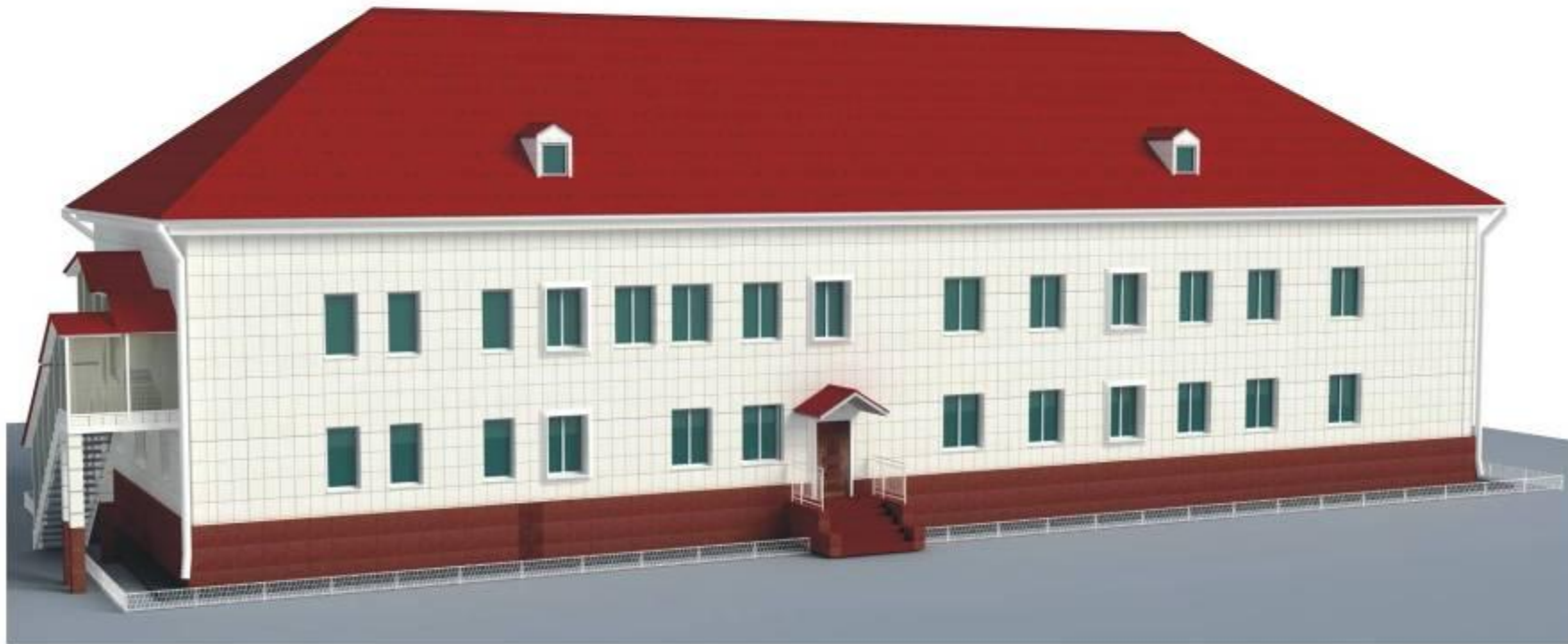
ПЕРСПЕКТИВА ТОРЦЕВОГО ФАСАДА