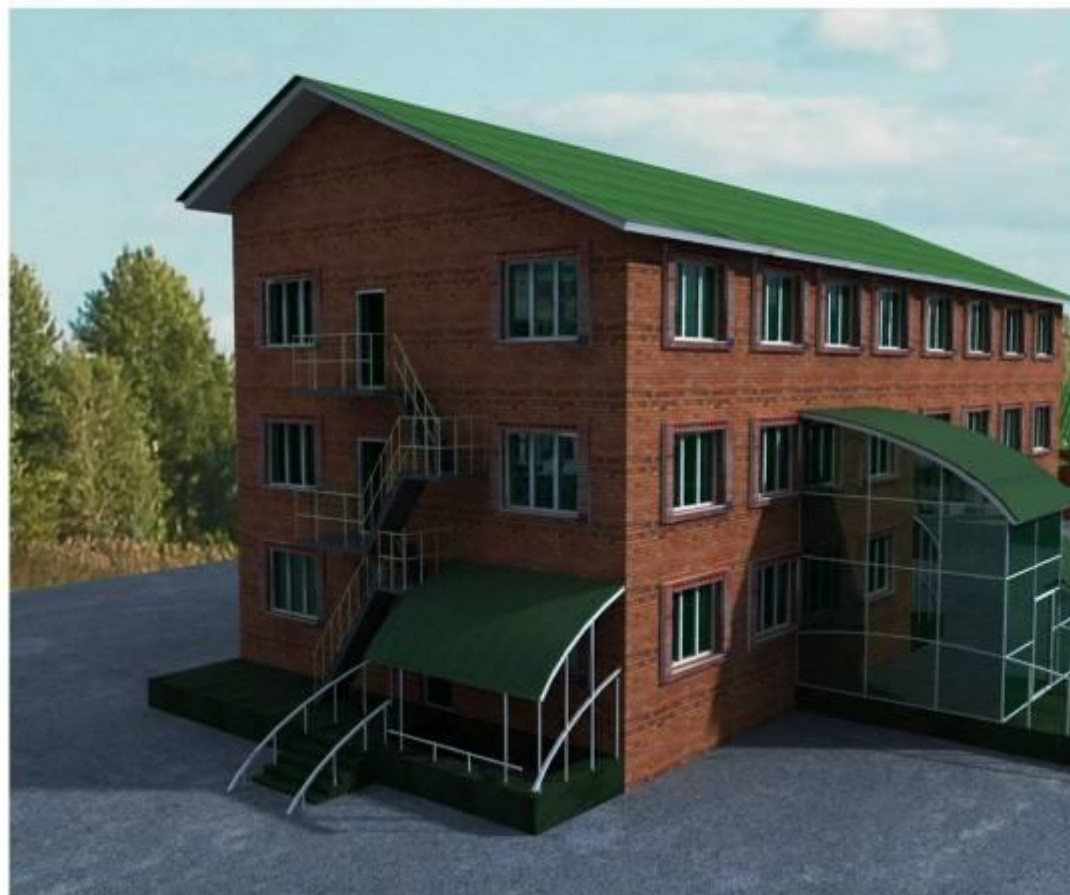
ПЕРСПЕКТИВА ТОРЦЕВОГО ФАСАДА