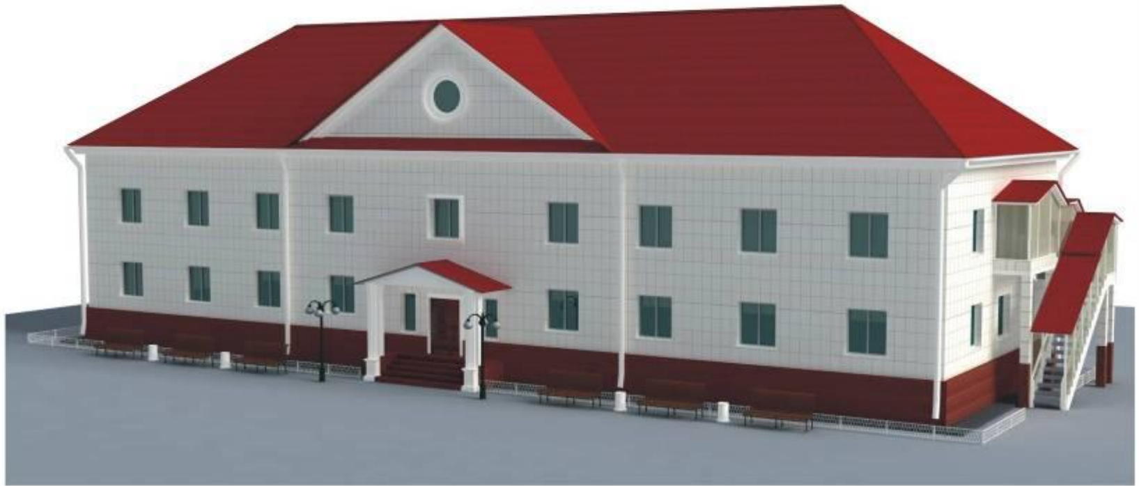
ПЕРСПЕКТИВА ГЛАВНОГО ФАСАДА