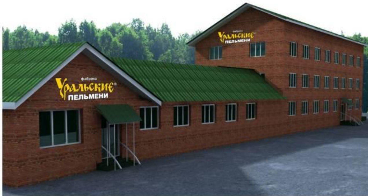
ПЕРСПЕКТИВА ГЛАВНОГО ФАСАДА