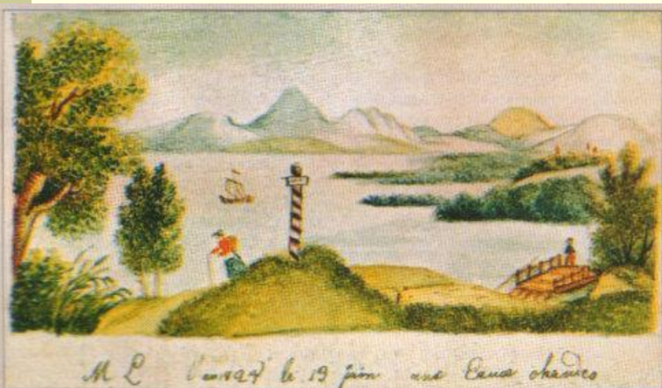
М.Ю. Лермонтову в 19 лет от бабушки Детский рисунок М.Ю. Лермонтова. Из альбома М.М. Лермонтовой