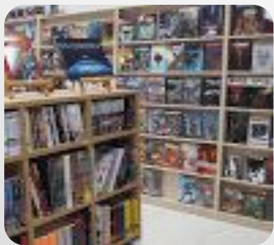
Comic Store ideo-grafika