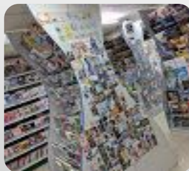
Аниме Магазин Pulsar