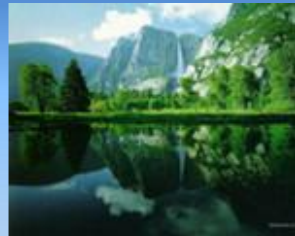
Реки, озера, болота 0,03 %