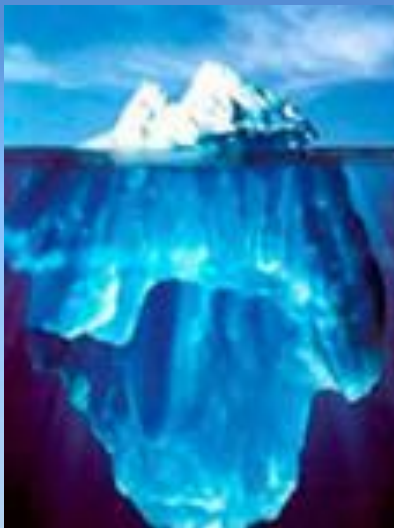
Ледники 1,75 %