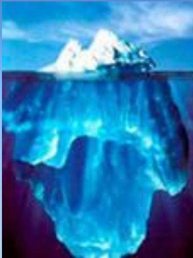
Ледники 1,75 %