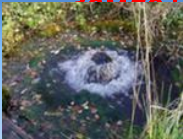
Подземные воды 1,7 %