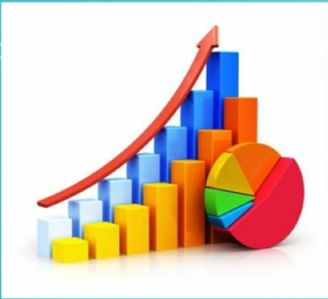
СХЕМА ПОСТРОЕНИЯ ОБРАЗА ПРОФЕССИОНАЛЬНОГО БУДУЩЕГО