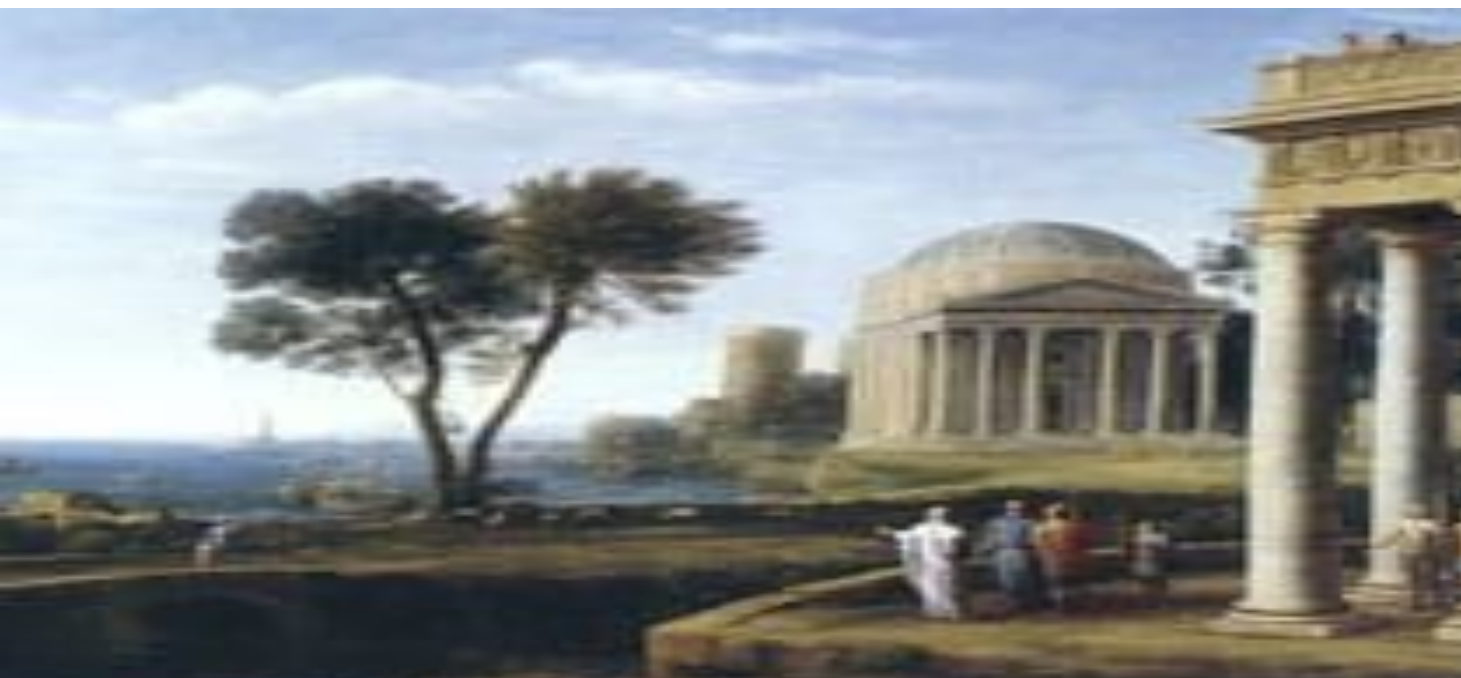
Лоррен Клод. Пейзаж с Энеем. 1662.