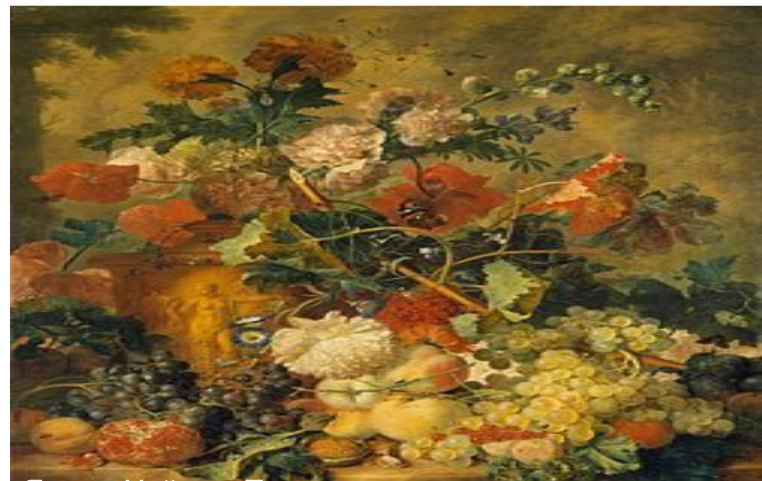
Ян ван Хейсум. Фрукты и цветы. 1726.