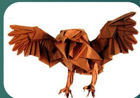
складывание по развертке