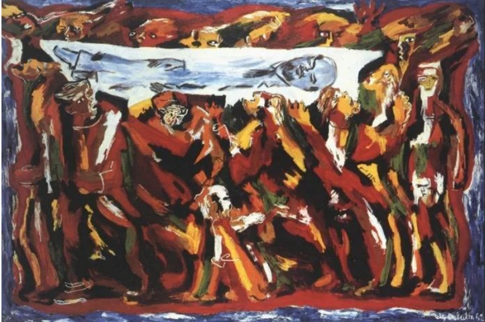
«Реквием» Э.М. Белютин