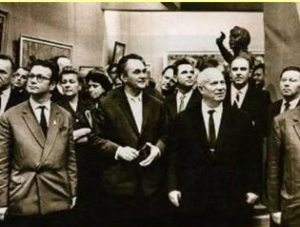
Хрущев на выставке в Манеже. 1962 г.

1 декабря 1962 г. – посещение Хрущевым художественной выставки в Манеже, посвященной 30-летию МОСХ.