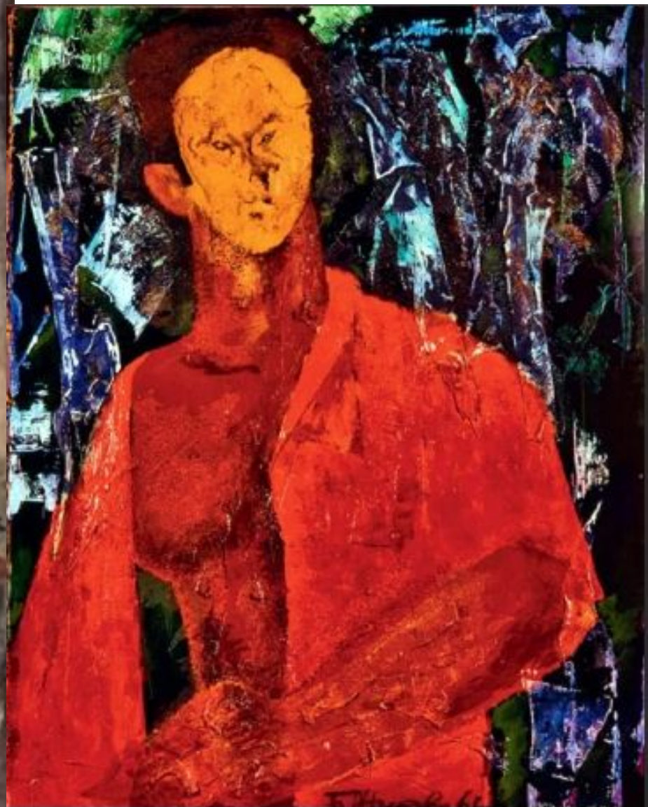
Борис Жутовский. Автопортрет. 1961г.