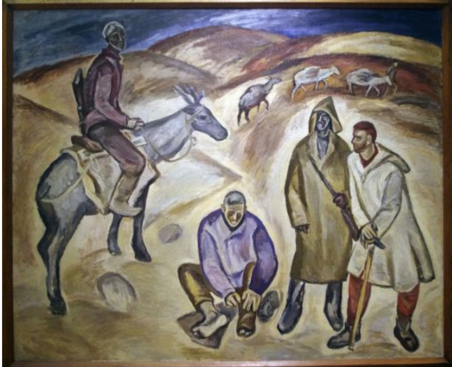
П. Никонов «Геологи»