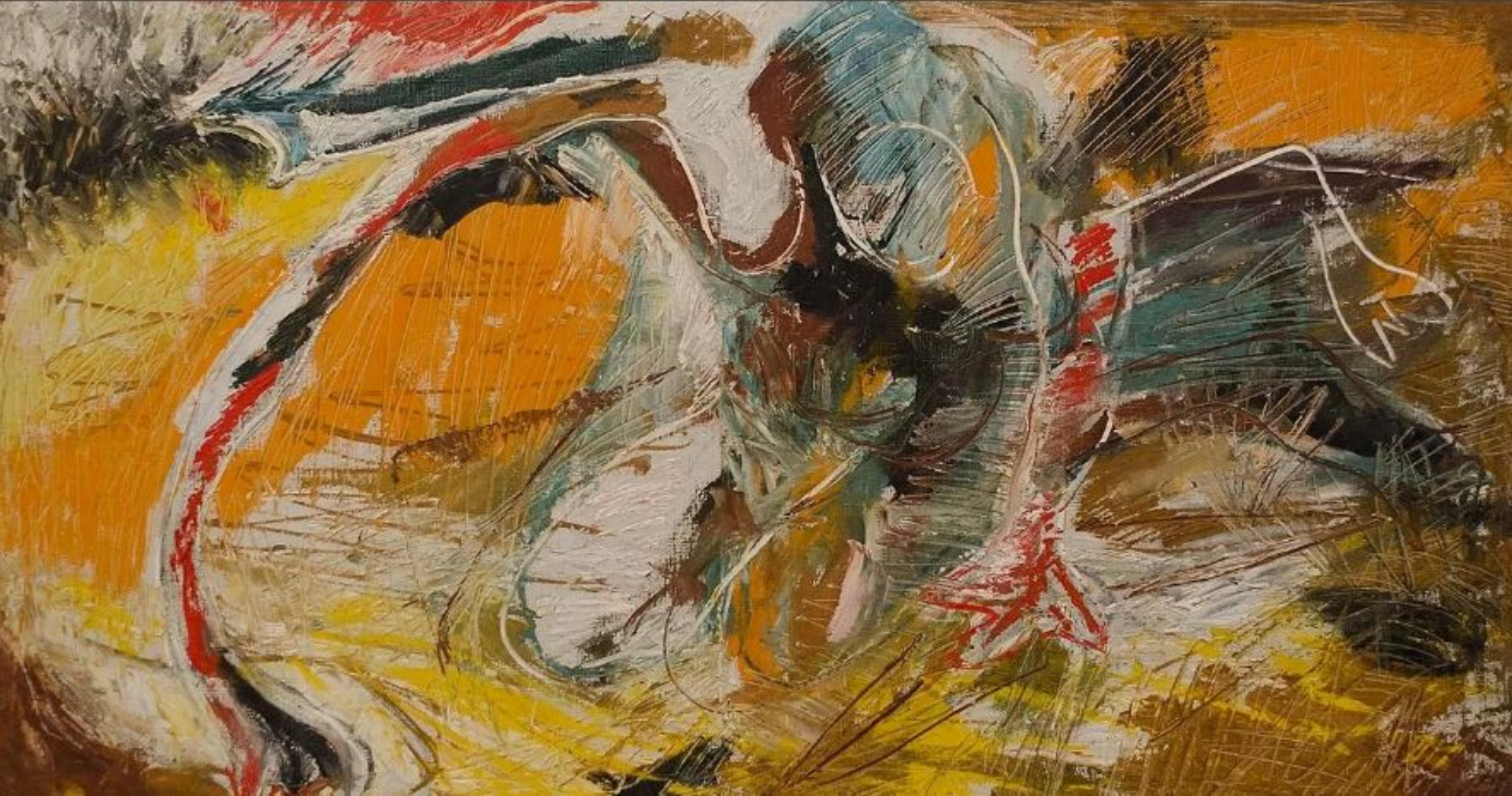
«Женская фигура» Э.М. Белютин