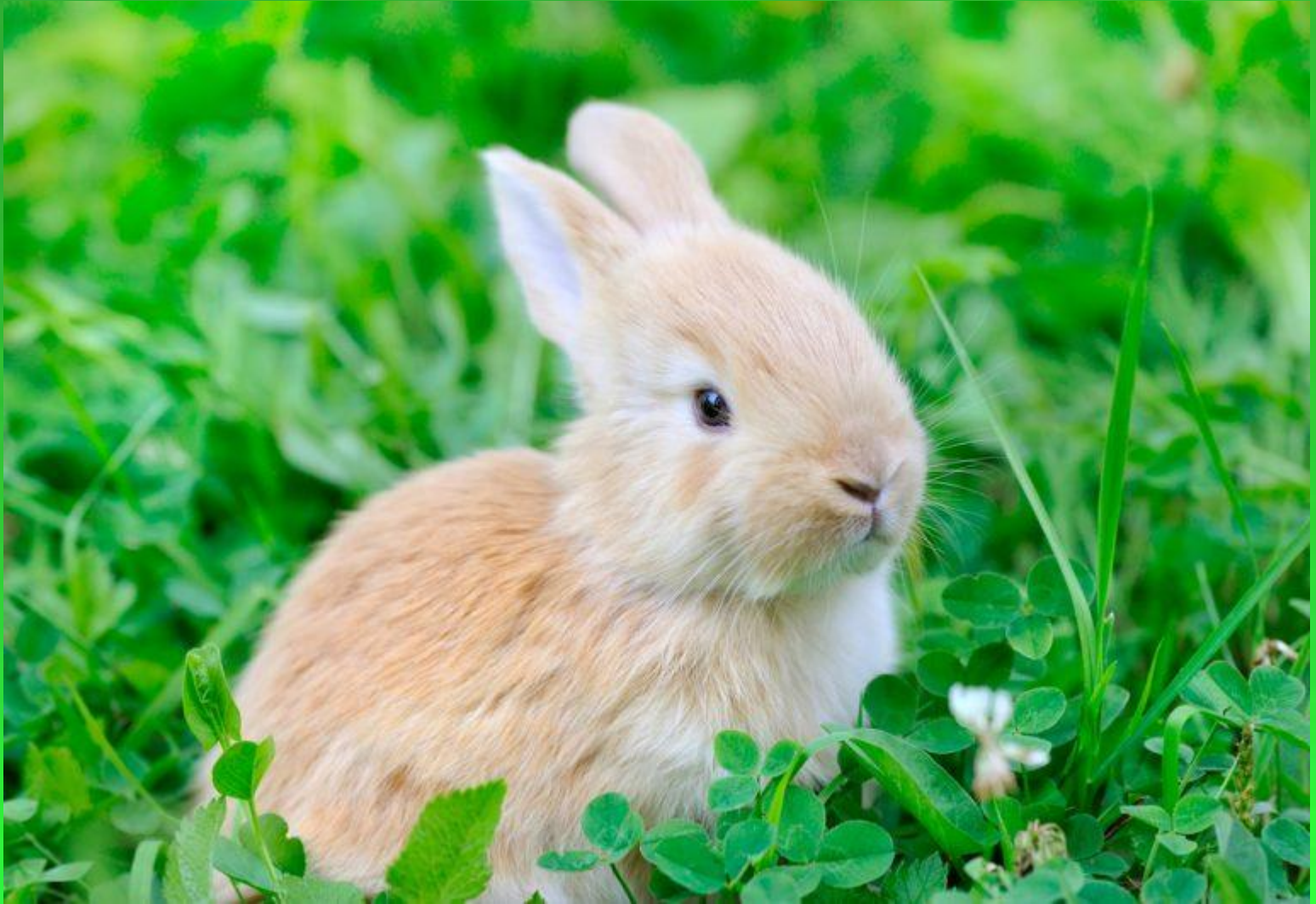
ФОТО ДОМАШНИХ КРОЛИКОВ