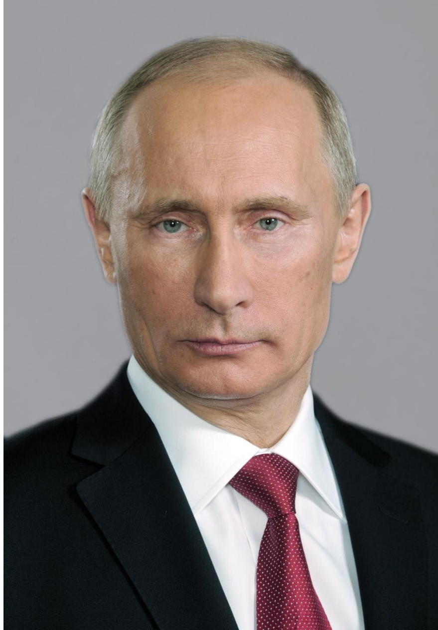
В.В. Путин – родился 7 октября 1952 г.