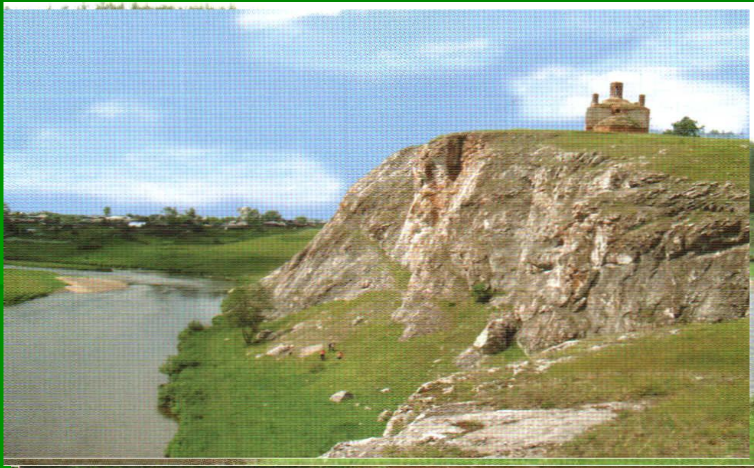
Церковь в поселке Макамушев Каверун