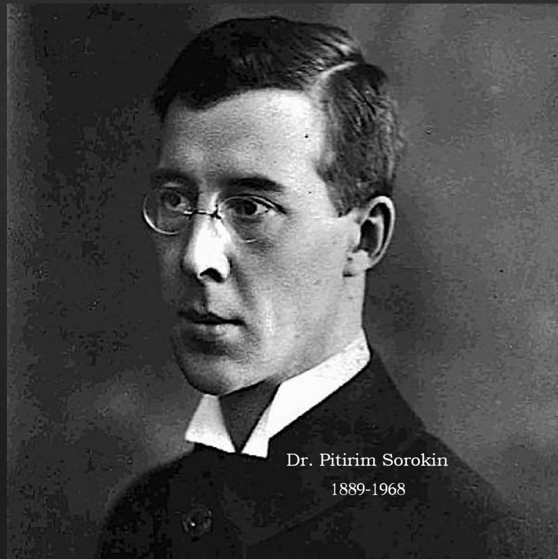
Dr. Pitirim Sorokin